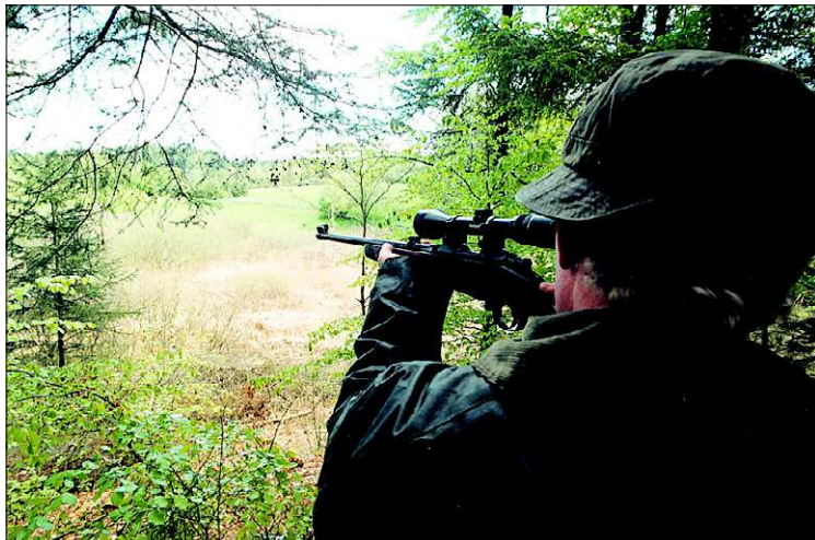
Forud for bukkejagten afholder Læsø Jagtforening riffelprøve på skydebanen.

- Det er igen i år en fridag, så vi håber at se rigtig mange. Det er en meget hyggelig tradition at få en lille snak om, hvad de forskellige har oplevet om morgenen og selvfølgelig at se, hvad der kan ligge på paraden. Det er også i forbindelse med bukkejagten, at vi uddeler årets Krage/skadepokal i samarbejde med Læsø Strandjægere og Jagtselskabet i Kærene. Pokalen er en hyldelse til dem, der gør mest for at reducere antallet af krager og skader, som jo kan være ganske hårde ved småvildt.