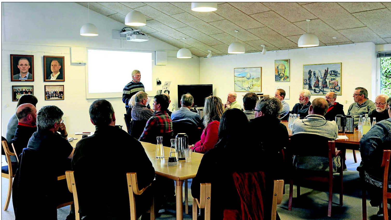
Kommunens mødesal var fyldt, da Læsø Natura - 2000 Lodsejerforening indkaldte til generalforsamling.