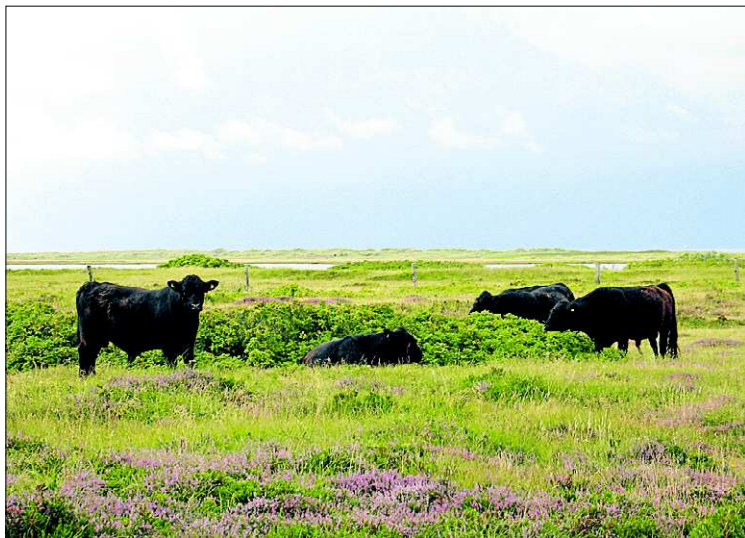
Slagtning og afsætning af kødkvæg fra Læsø i større mængder er en udfordring, som foreløbigt er lagt i skuffen.