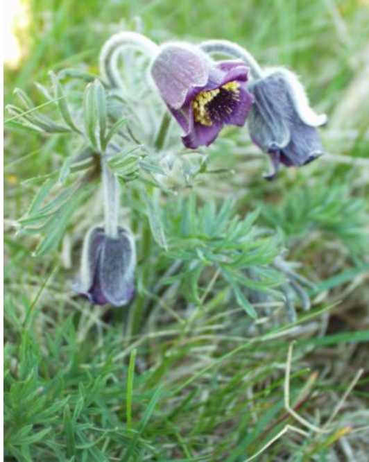
Ansvarsarten Nikkende Kobjælde findes talrigt i klitterne ved Solsbæk