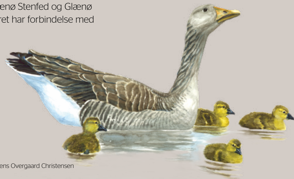
Grågås. Illustration: Jens Overgaard Christensen

Smålandsfarvandet gennem to smalle løb mellem henholdsvis Østerfed og Bisserup Havn og mellem Østerfed og Stenfed. Feddene forandres imidlertid til stadighed som følge af materialevandring fra vest mod øst. Vest for Holsteinborg Nor ligger et af landets ældste vildtreservater, Basnæs Nor Vildtreservat. Norene deles af vejdamningen til Glænø. Store dele af Holsteinborg Nor tørlægges i perioder, og på de blotlagte flader af sand og mudder er der en stor produktion af fødeemner for fugle.