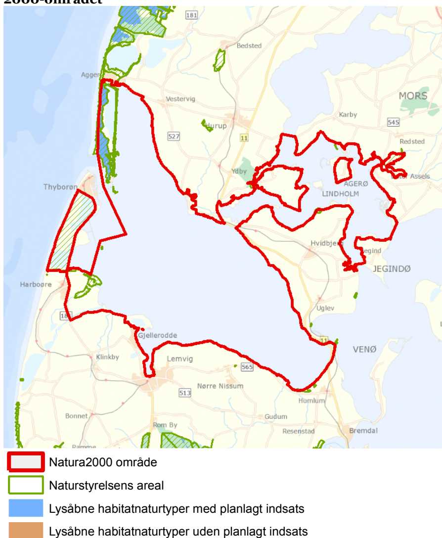
Figur 3: Oversigt over lysåbne naturtyper og planlagte indsatser i Natura 2000-området

Plejeplanen er udarbejdet i overensstemmelse med Natura 2000-planens målsætninger, der indeholder følgende områdespecifikke retningslinjer fra Natura 2000-planens indsatsprogram