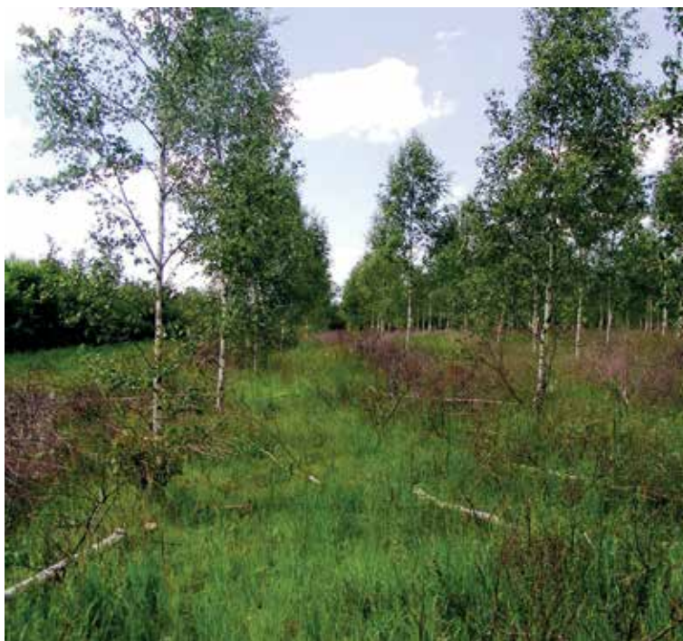
F.814 Randers Nørreskov i juni 2011 efter artsscreening og tynding.

Artsrenhed: Som følge af dokumenteret indblanding af dunbirk i frøkilden, blev frøkilden artsscreenet i vinteren 2010/2011. Til artsscreeningen blev anvendt en kemisk test, som entydigt angiver hvorvidt der er tale om dunbirk eller vortebirk. Testen udnytter, at der i kambielaget (vækstlaget mellem bark og ved) hos vortebirk findes et phenolstof, som helt mangler i dunbirk. Morfologiske karakterer (ydre, synlige kendetegn) blev ikke anvendt i artsscreeningen, da de har vist sig ikke at være velegnede til entydig og sikker artsbestemmelse. Det skyldes, at de morfologiske karakterer ofte er ustabile i træernes voksenstadium.