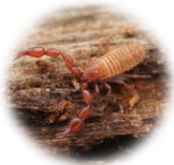
Mosskorpion (1-5 mm)

Fyld kassen med en blanding af savsmuld, blade og småkviste (gerne løvtræ) til ca. 5 cm under indgangshullet. Afslut med 1-2 l vand