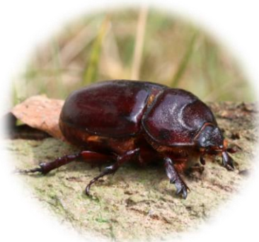
Næsehorns bille (25-40 mm)

Montér kassen på et træ med fx spændbånd eller reb. Alternativt kan den monteres på en mur, gerne østvendt