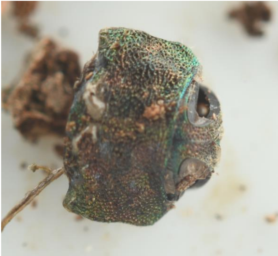
Figur 5: Forkrop (pronotum+hoved) fundet under bark med larvegrav.