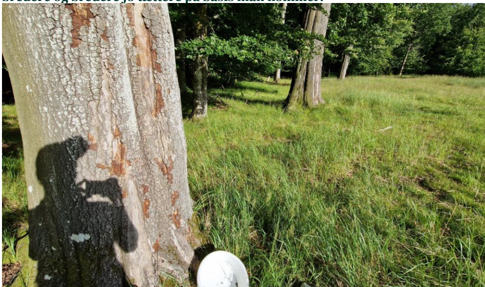
Figur 7: Levested - solbeskinnede bøge i skovbryn