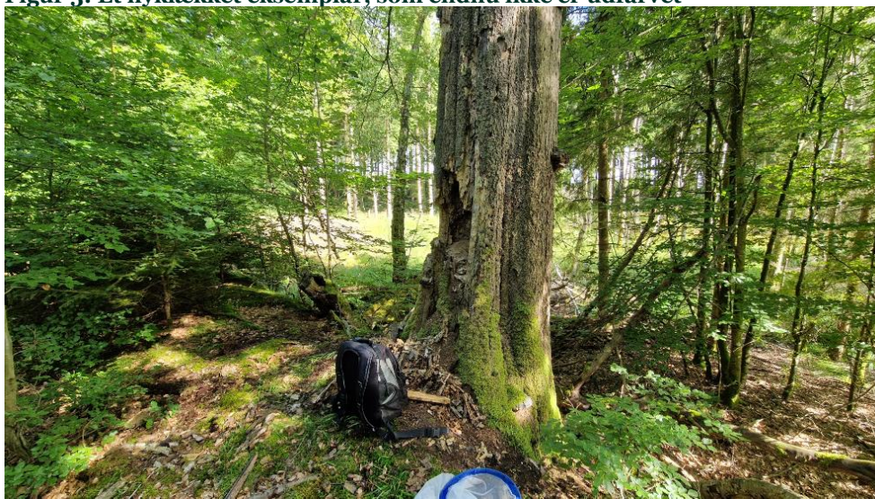
Figur 4: Levestedet. I dette tilfælde er hulheden ikke en klassisk hulhed, der er