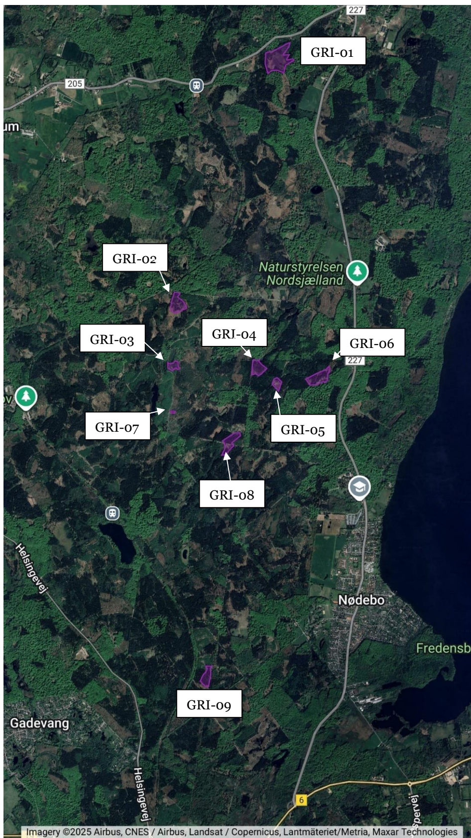
Figur 1: Undersøgte polygoner og deres navne. Navngivningen er identisk med den i GIS-filerne.