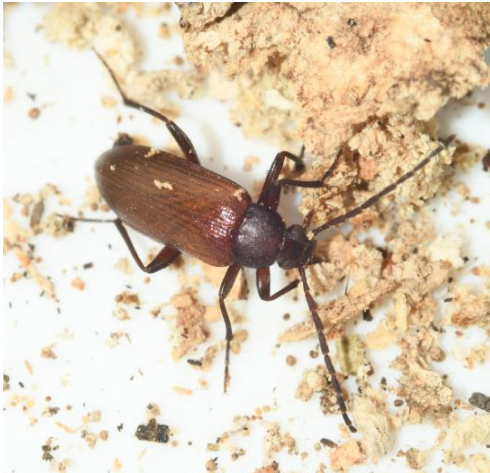
Figur 3: Et nyklækket eksemplar, som endnu ikke er udfarvet