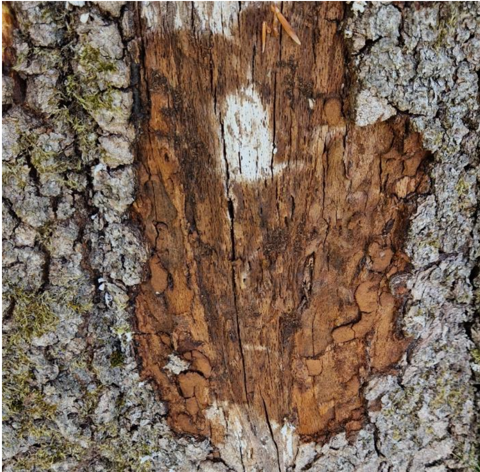
Figur 6: Larvegrav fra bunden af stammen. Sporene starter oppefra og bliver bredere og bredere jo tættere på basis man kommer.