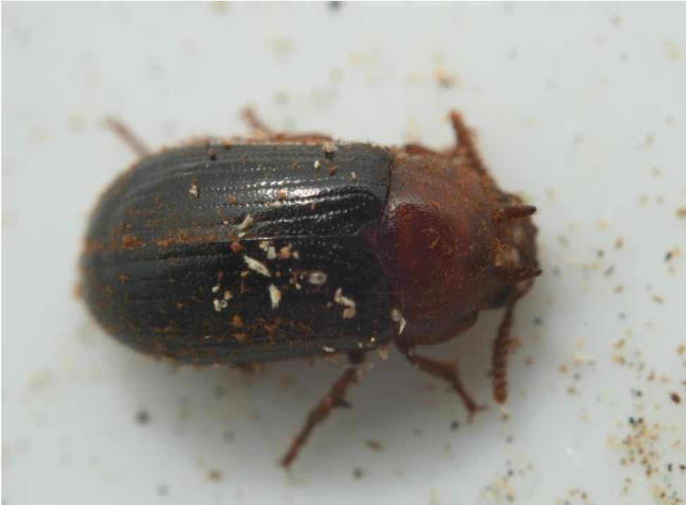
Figur 8: Han med hornene i panden