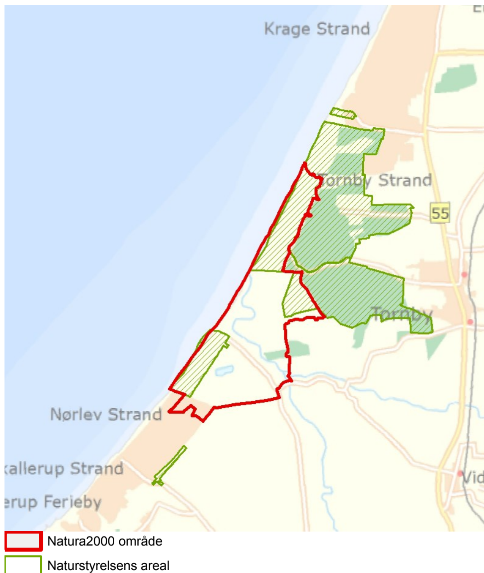
Figur 1: Oversigtskort over Natura 2000-områdets afgrænsning

Denne plejeplan følger op på Natura 2000-planen for område N6 Kærsgård Strand, Vandplasken og Liver Å, der består af habitatområde med samme nummer og navn og vedrører Naturstyrelsens arealer på ca. 150 ha.