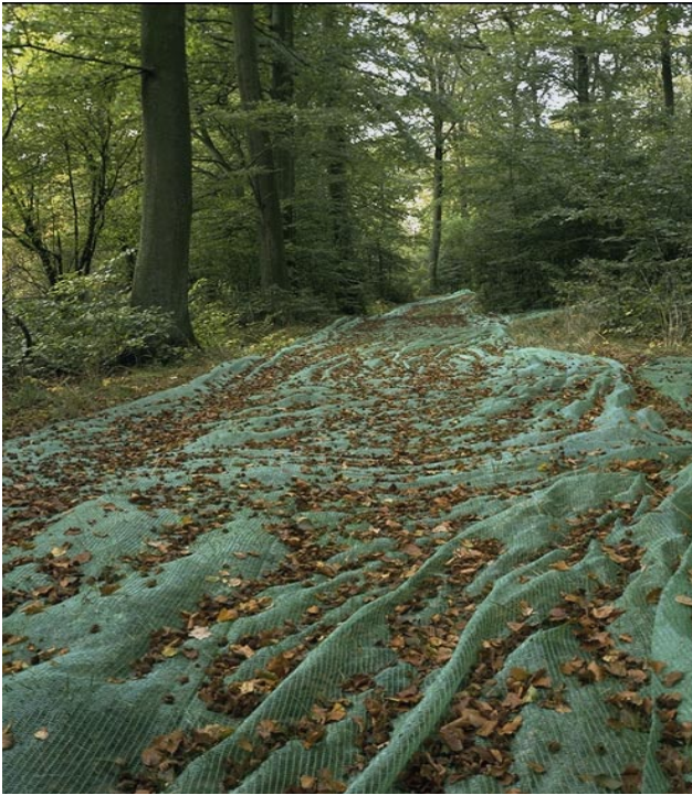
Frøindsamlingen foretages på udlagte net.