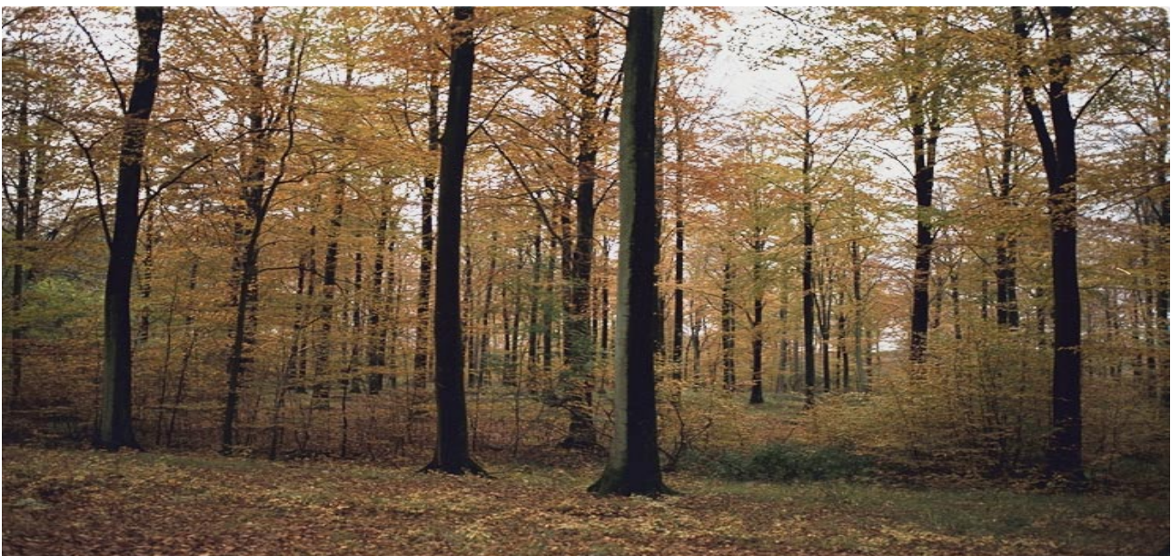
Indsamlingsområdet i afd. 44/47.

Henvendelse til Statsskovenes Planteavlsstation, tlf.: 49 19 02 14.