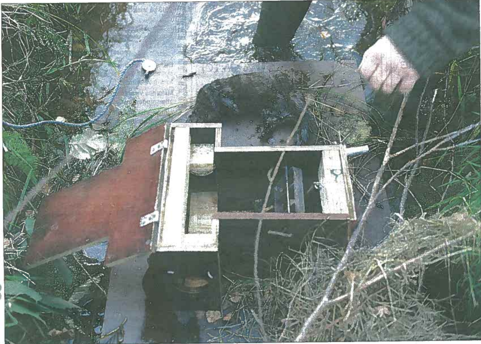
ENKELTE MINK er i årets løb blevet fanget i Life-projektets fælder.

-Vi har dog ofte været i en situation, hvor der blandt øens entreprenører ikke var ressourcer til opgaver for projektet. Dette har medført forsinkelser i forhold til det ideelt projektforsløb og i et del tilfælde er opgaverne stedet udført af medarbejdere fra Læsø kommune eller Naturstyrelsen. Vi ser selvfølgelig gerne at entreprenører spiller en mere fremtrædende rolle fremover, fastslår projektlederen.