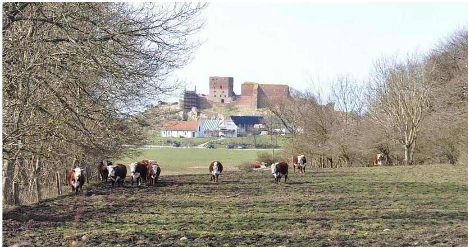
Centerlinie fra Hammersholm, Slotsgården i forgrunden

Slotsgården ligger uheldigt midt i centrale sigtelinier fra Hammersholm, og forstyrrer oplevelsen af Hammershus beliggende på sin karakteristiske klippeknupe midt i et unikt landskab. Naturstyrelsen vil nedrive Slotsgården som en del af projektet.