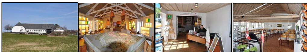
Slotsgård, udstilling, billettering, café

De besøgende betjenes i dag fra Slotsgården, som rummer en lille udstilling med fokus på folkeliv på borgen i 1400-tallet, samt café, kiosk og toiletter. Faciliteternes kapacitet og formidlingens kvalitet står ikke mål med nutidens krav. Det er hovedelementet i projekt at opføre et nyt tidsvarende besøgscenter placeret nænsomt i landskabet således at sletten foran Hammershus fritlægges.