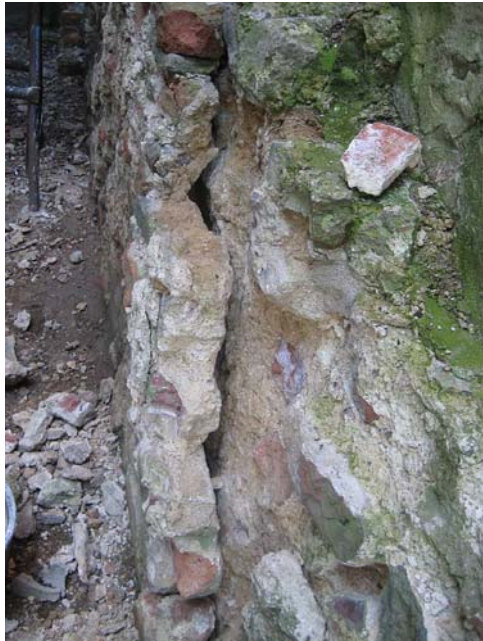
Alvorlig skade i Manteltårn vinteren 2010-11

Restaureringen gennemføres med Naturstyrelsen som projektleder og forventes i perioden at beskæftige 13-14 håndværkere og lærlinge.