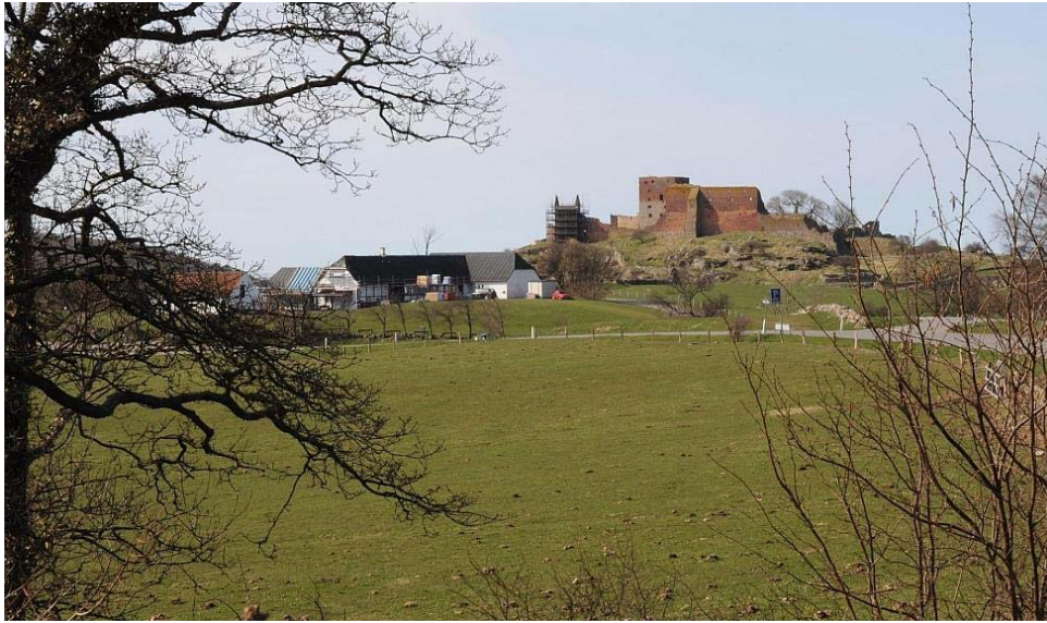
Hammershus set fra Hammersholm-Hammershøj-linien