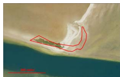
Kort over de statsejede øer i ydre del af Randers Fjord. Øerne er markeret med rødt. Luftfoto er fra 2006.