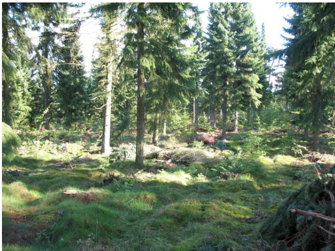
Bevoksninger af omorikagran er nu lysstillet og underplantet med løvtræer