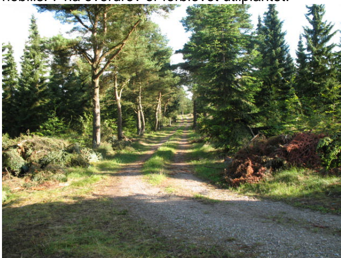
Langs vejene bevares gamle skovfyr af landskabelige årsager

De markjorder, som blev tilkøbt i 1991, er tilplantet med kulturer af løvtræ, ædelgran, sitkagran og nobilis. 7 ha overdrev er forblevet utilplantet.