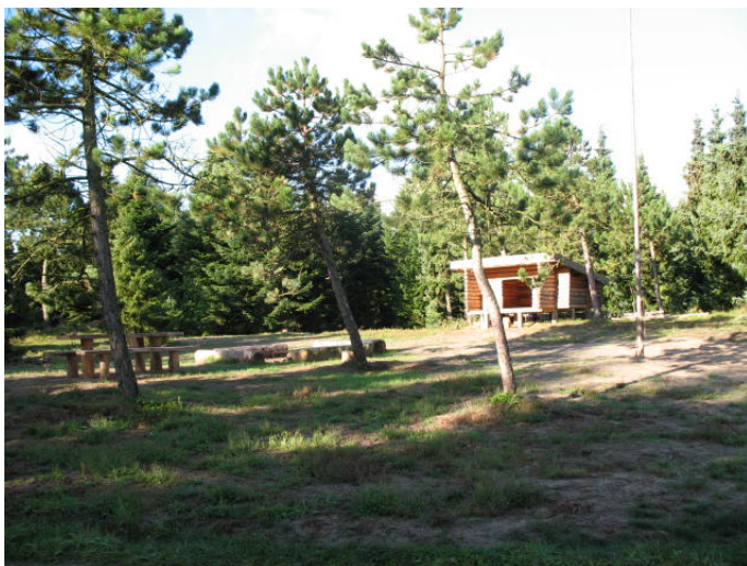
Bål- og shelterpladsen

Plantagen bruges meget af lokalbefolkningen til skovture og hundeluftning. I de senere år er der gjort en del for at henlede opmærksomheden på, at plantagen faktisk findes. Det er sket ved opsætning af skilte på henholdsvis Klitmøllervej og Klatmøllevej. Der er etableret en P-plads i nordkanten af plantagen, og der er i samarbejde med Vandet-Skinnerup Borgerforening opført et shelter med borde/bænke og bålplads. Stier og grønne spor slås i sæsonen af hensyn til skovtursfolket.