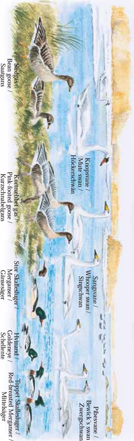
Sædgæs / Bean goose / Sætgæns