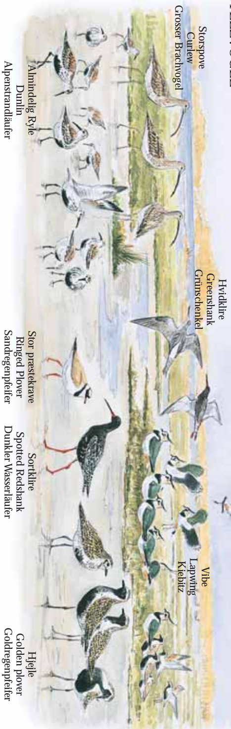
Storspove Curlew Grosser Brachvogel Almindelig Ryle Dunlin Alpenstrandaüfer