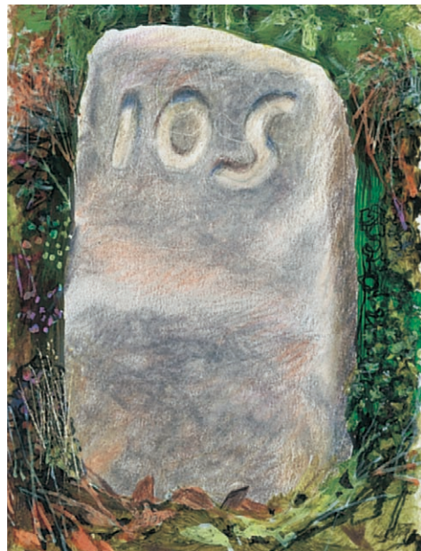
Vejpligtstenen ved Frueskovvej.

Til fods kan man følge den afmærkede vandrerute. Det tager ca 2 timer at gå hele ruten igennem. Hvis man starter på p-pladsen i Hønsnap Skov ved Fjordvejen, kan man f.eks. vælge kun at gå runden omkring Springom Dammene. En mellemlang rute kan laves ved at undlade delen i Kelstrup Fredskov. På den måde kommer man forbi de to nok smukkeste områder i Sønderhavskovene ved Springom Dammene og Frueskovvej.