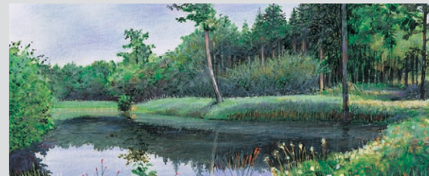
Den nordlige Springom Dam i Hønsnap Skov.