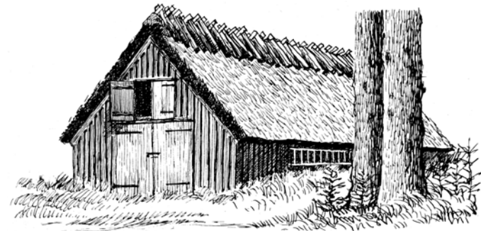
Den nu nedrevne Agernlade

I 2008 blev den gamle Agernlade nedrevet, og der blev opført et nyt madpakkehus i stedet. Madpakkehuset er åbent for alle og det kan ikke reserveres.