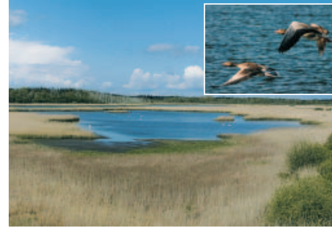
Ved dæmningen er opsat et fugletårn, hvorfra der er gode muligheder for at iagttage fuglelivet

vat. Det betyder, at man - af hensyn til fuglene - ikke må gå ud i rørskovene og de indhegnede områder. Til gengæld har skovdistriktet afmærket flere vandreture med udgangspunkt i de afmærkede P-pladser. Der er opsat informationsskilte og bokse med en vandretursfolder for området.