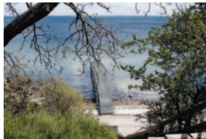
Naturlejrpladsen ved Unnerød Huse med egen badebro

Unnerud Huse: Teltpladsen ligger på en høj kystkrænt. Der er bålplads med grill, borde og bænke. Der er adgang til vand og toilet. Pladsen må benyttes én nat.