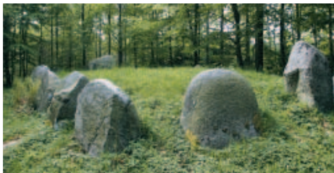
Langdyssen Kong Øres Grav er bygget af kæmpestore sten sat i en oval om stenkammeret bestående af fire sten og en overligger. Oprindeligt har gravkammeret været dækket af jord, som delvist må være fjernet, når man skulle gennemføre en ny gravlæggelse

når han levede, forlyder der desværre ikke noget om. Ved stendyssen Tingstedet (3) , som ligger få hundrede meter fra P-pladsen, mødes fortid og nutid, når man mellem de store bautasten ser Kyndbyværket rejse sig i horisonten. I den nordlige ende af skoven passerer militære træningsbaner for blandt andet frømandskorpset.