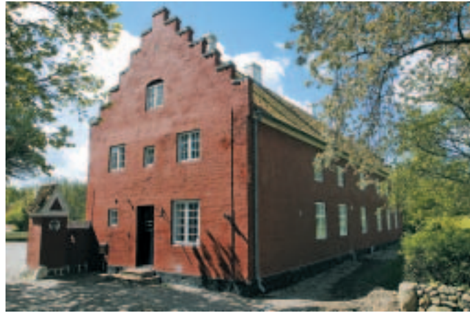
Portnerboligen til Anneberggård med fine takkede gavle.

Avlsgården og den fine portnerbolig (9) har siden 1916 været skilt fra hovedbygningen. I 2003 overtog Odsherred Kulturhistoriske Museum imidlertid avlsbygningerne, og planen er nu sammen med skovdistriktet at genskabe muligheden for at opleve hovedgården i sin helhed.