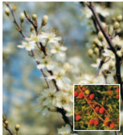
Mirabel blomstrer i hegnene i april og byder senere på året på fristende frugter

vej, hvor man bestandig belønnes med storslåede fjordudsigter. Nord for Stokkebjerg Skov har vandreruten sit eget forløb langs med levende hegn. Vandre- og cykelsti mødes igen ved Glostrup Overdrev og fortsætter videre ad en lille markvej til Egebjergvej . Cyklister og vandrere bør være opmærksomme på, at Fjordstien herfra og frem til Annebjerg Skov er stærkt trafikeret. Det samme gælder stykket lige nord for Annebjerg Skov . Som udgangspunkt er det forbudt at ride på stien.