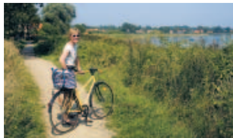
Cyklist på Fjordstien

fjorden. I 2006 forventes Fjordstien videreført over Tuse Å og engene i bunden af Holbæk Fjord til Mårsø . Indtil den ny sti bliver anlagt følges kommuneveje til Mårsø og herfra videre til: Hørbygård - Favrbjerg - Gurrede - Avdebo - Lammefjordsdæmningen - Plejerup - Atterup - Siddinge Fjord . Efter dæmningen over Siddinge Fjord følges vejen mod Kongsøre Næbbe . Kort efter Brådegård følges skovvejen gennem Kongsøre Skov til Sandskredet .