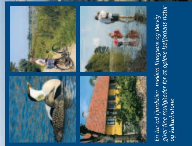
En tur ad Fjordstien mellem Kongsøre og Rørvig giver fine muligheder for at opleve Isefjordens natur og kulturhistorie