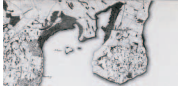
Generalkvartermesterstabens kort, opmålt i årene 1810-1821. Kortet viser Ringholm og Hov Vig før inddæmningerne.

da landet hævede sig, hvorved Nakke og Nørrevang - hjulpet på vej af aflejret grus og sand - blev kittet sammen med fastlandet. I 1869 blev også Ringholm føjet til halvøen, da man ved hjælp af dæmninger tørlagde fjorden bag ved holmen.