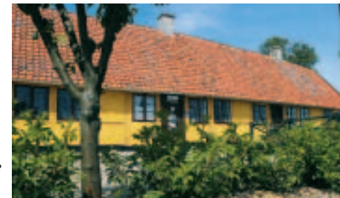
Lodsoldermandsgården i Rørvig Havn

På Rørvig Havn ligger den fredede bygning Lodsoldermandsgården (14) , som blev bygget i 1660. Den hed oprindelig Rørvig Toldstation , og udover toldfunktionen blev al lodsvirksomhed organiseret herfra gennem mere end 300 år. Alle skibe, som ville ind gennem Isefjorden eller Roskilde Fjord , måtte tidligere tage en lods ombord. Fiskerne i Rørvig havde alle kort på hånden for at løse opgaven, for de havde et nøje kendskab til de sandbanker i fjordens gab, som gjorde sejladserne til en risikabel affære. Samtidig skulle skibene fortolde. Det skete, mens de lå i den dybe vig bag Skansehage . På havnen ligger også røgeriet, hvor det er fristende at proviantere lidt her ved slutningen af - eller starten på - en tur ad Fjordstien mellem Kongsøre og Rørvig .