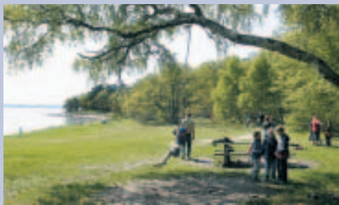
Udsigt langs kysten ved Sandskredet.

Ved Sandskredets P-plads er fine grillsteder, borde/bænkesæt samt mulighed for at springe i bølgerne fra badebroen. Også handicappede har mulighed for at bade fra en handicapvenlig badebro. Fra april til oktober er der adgang til toilethuset, som også er tilgængeligt for handicappede. Skovdistriktet har opsat informationsskilte samt en boks med vandretursfolderen Kongsøre Skov, Odsherred. Sandskredet nås i bil ved at køre fra Hølkerrup ned af Sandskredsvej .