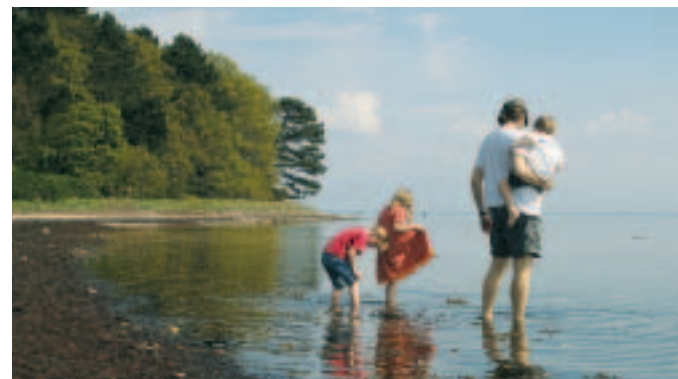
Fjordstien ved Sandskredet

Ved Fjordstien ligger flere naturlejrpladser, hvor du kan slå telt op. Derudover er der mulighed for at overnatte i shelters. Med mindre andet er angivet, er de gratis at benytte. Der er også mulighed for at overnatte i området på campingplads, vandrerhjem, kro eller hotel. Turistbureauet oplyser adresser og telefonnumre.