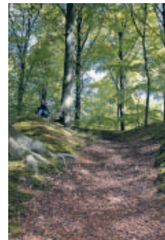
Manglebjerg indbyder til bjergbestigning.

Skoven blev samlet i 1770'erne af skovarealer hørende til de omkringliggende landsbyer og styrket ved, at der blev plantet nye træer. I store træk den samme historie som for Kongsøre Skov . Det smukkeste gamle stengærde kanter hele skoven, men ses bedst fra Skaverupvej langs sydsiden af skoven eller Egebjergvej langs østsiden af skoven.