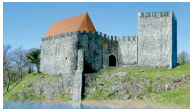
Digital rekonstruktion af borgen.

Lilleborg blev ikke genopført, men møntfund fra borgområdet slået i Kong Erik Klippings regeringstid (1259-86) viser, at der har været efterfølgende aktivitet på stedet. Selvom borgen var nedbrændt, kunne mange af borgens sten genbruges. I