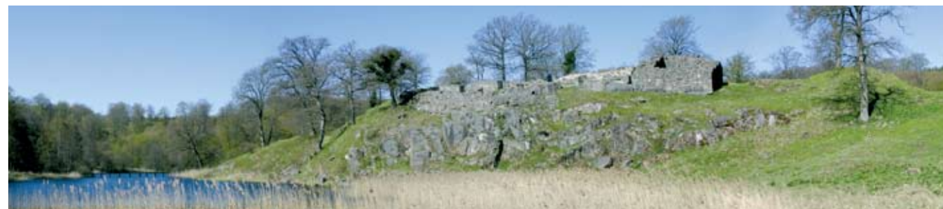
Panorama over Lilleborg-ruinen set fra øst.

Ligesom Gamleborg blev Lilleborg i 1821 beskyttet gennem fredning. Ruinerne fra borghusenes grundplan og ringmuren langs klippekudens kant, som stadig ses, repræsenterer på bedste vis historien om de tidlige middelalderborge i Danmark.