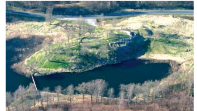
Lilleborg på klippeknoten i Borresø set fra syd. Borgens ladegårdsareal ligger i græsset nordøst for borgen udenfor det befæstede område. I skoven omkring borgen findes også adskillige hulveje og oldtidsagre, samt dæmninger som har reguleret søens vandspejl.

Klippeknoten i Borresø har været benyttet gennem årtusinder. I søen er der fundet stenøkser og ravperler fra bondestenalderen for ca. 5.000 år siden. En bronzeøkse og små indhuggede fordybninger, såkaldte skåltegn, på klippen i borggården vidner om aktivitet i bronzealderen mellem 1.800-500 f.Kr. Borresø har også leveret et flot skattefund fra