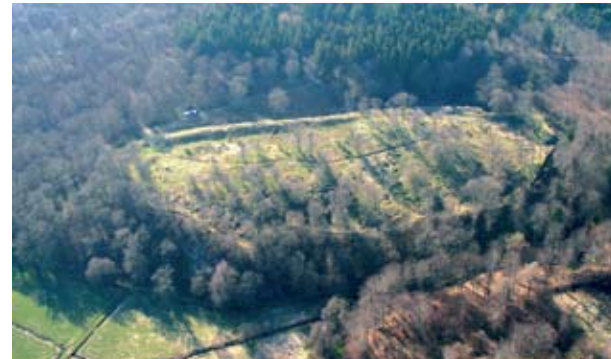
Gamleborg set fra sydøst med den store vold langs kanten af borgområdet.

Gamleborg har flere byggefaser. Udgravninger i 1951-55 viste, at borgen er grundlagt i vikingetiden. Udformningen har rødder tilbage i jernalderens folkelige tilflugtsborge, som blev benyttet i ufredstider. Oprindeligt bestod befæstningen af en massiv kampestensvold med jord og ler, som blev taget fra den store borgplads. Mod nord og syd var der portåbninger, som på ydersiden var forstærket med voldgrave og ydre volde. Selve borgpladsen har naturligvis huset forskellige bygninger