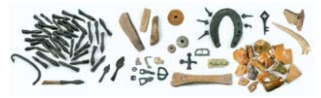
Fund fra Lilleborg-udgravningerne bl.a. ambrøstpile, pilespidser, slibesten, skøjte i ben, nøgler, smykker, tenvægte samt importeret, glaseret keramik. Bemærk også den fine dobbelte benkam.

En solid ringmur langs den vandomsluttede klippeknodes kant afgrænser den ovale borgplads. Der var kun adgang til borgen gennem den solidt forskansede portåbning i sydøsthjørnet af ringmuren, og et stort tårn, hvorfra hele området kunne overskues og forsvares, blev senere tilføjet i den øst-