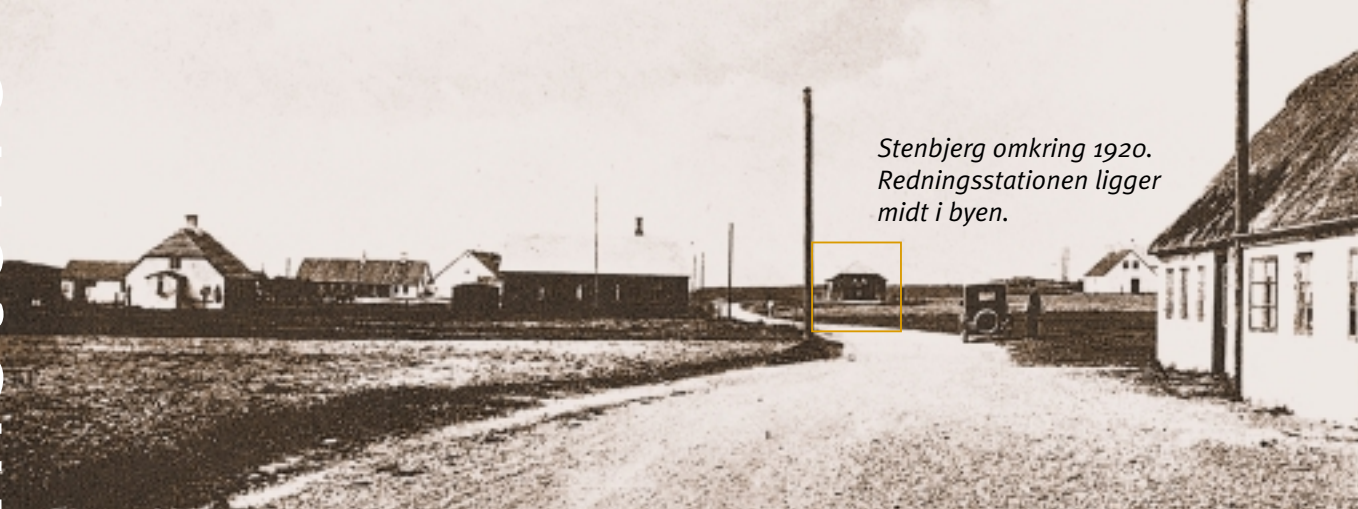
Stenbjerg omkring 1920. Redningsstationen ligger midt i byen.

I 15- og 1600-årene hærgede sandflugten Thy. Et mange kilometer bredt bælte langs kysten dækkedes af flyvesand, og bønderne blev fordrevet mod øst. Det er nemt at forestille sig hvilke problemer det medførte, når en stadig større befolkning måtte klare sig på stadig mindre jord.