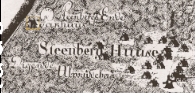
Udsnit af forarbejderne til Videnskabernes Selskabs kort fra 1789.

Det første hus ved Stenbjerg Landingsplads var et pakhus, som blev anvendt i forbindelse med skudehandelen på Norge. Det fremgår af et forarbejde til Videnskabernes Selskabs kort fra 1789.