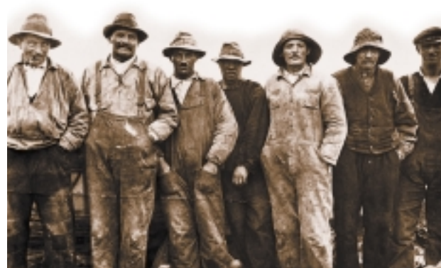
Fiskere fra Stenbjerg.

fiskeri som det bærende erhverv. 11 familier ernærede sig ved jordbrug, mens de resterende især var arbejdsmænd og enker.