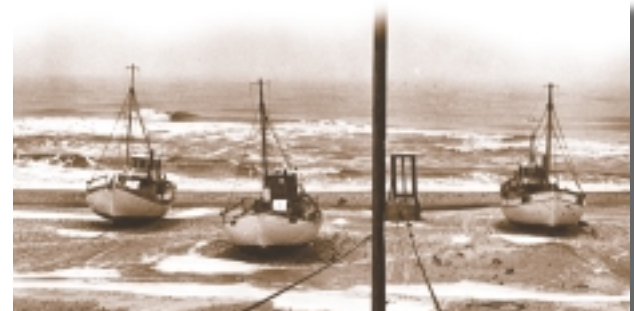
De tre sidste kuttere, Arken, Sara og Niels Juel på stranden omkring 1970.

Hertil er der blandt andet ydet et meget stort beløb fra A.P. Møller og hustru Chastine Mc-Kinney Møllers Fond til almene formål, og arbejdet er afsluttet i efteråret 2000.