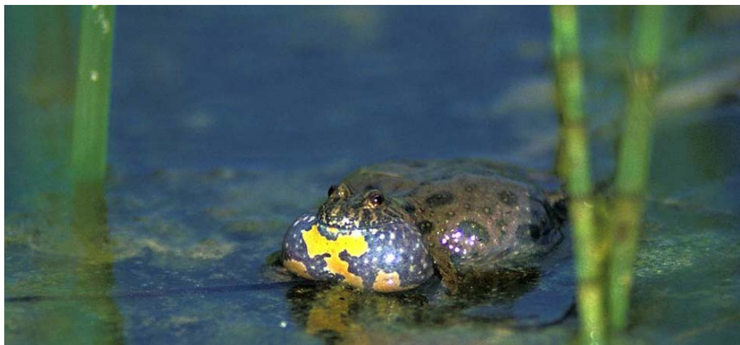
Billede 3 Klokkefrø udgør en del af udpegningsgrundlaget i Vestlige del af Avernakø. Artens levested forbedres bl.a. gennem LIFE Klokkefrø-projektet.