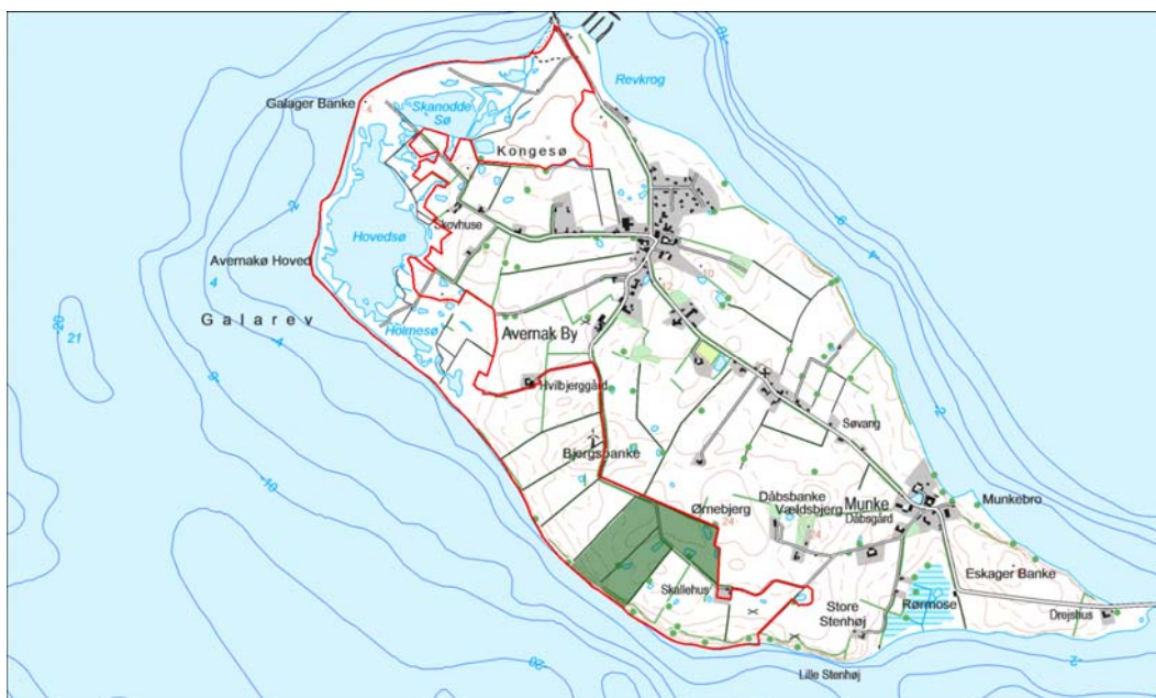
Billede 1 Oversigt over Natura 2000-områdets afgrænsning (rød streg) og styrelsens arealer (stærk grøn farve) i området.

Denne plejeplan følger op på Natura 2000-planen for område N125 Vestlige del af Avernakø og vedrører Naturstyrelsens arealer på 12 ha.