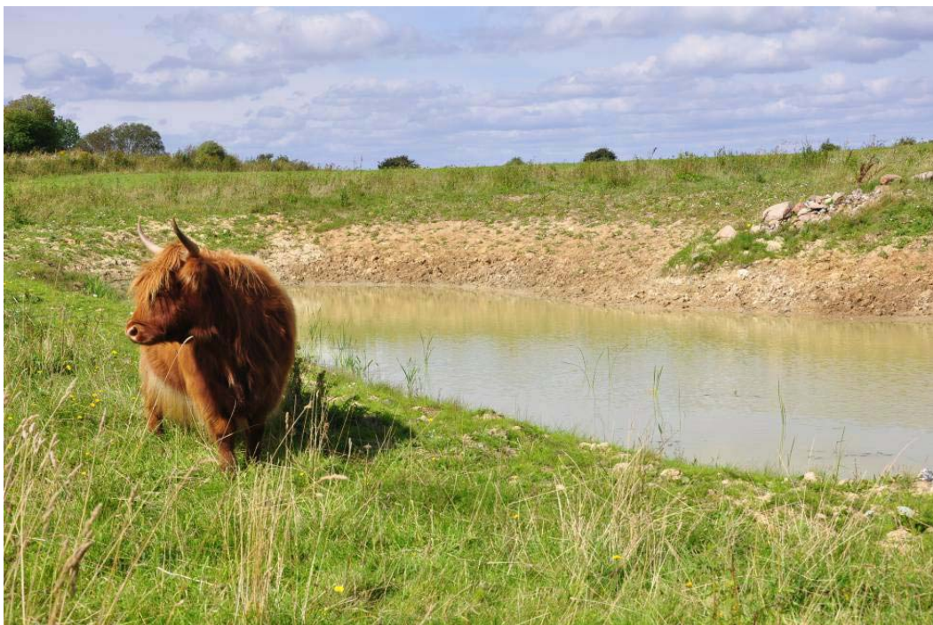
Billede 2 Nyetableret vandhul til klokkefrø. Det omgivende areal afgræsses af kreaturer.

For en uddybende beskrivelse af Natura 2000-området, herunder præsentation af udpegningsgrundlaget for området, henvises til Natura 2000-planen . På Naturstyrelsens hjemmeside kan der også findes forklaring af begreber mv.