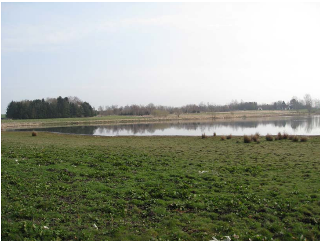
Billede 2 Udsigt over den vestlige ende af Ramsømagle Sø

For en uddybende beskrivelse af Natura 2000-området, herunder præsentation af udpegningsgrundlaget for området, henvises til Natura 2000-planen . På Naturstyrelsens hjemmeside kan der også findes forklaring af begreber mv.