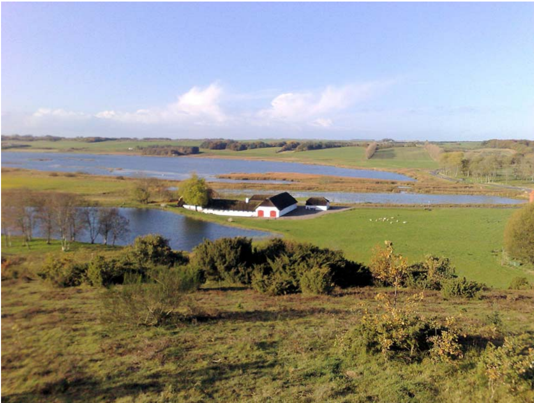
Billede 4 Halkær Naturcenter ligger på kanten af Halkær Ådal. Den store sø i baggrunden er den genskabte Halkær Sø.