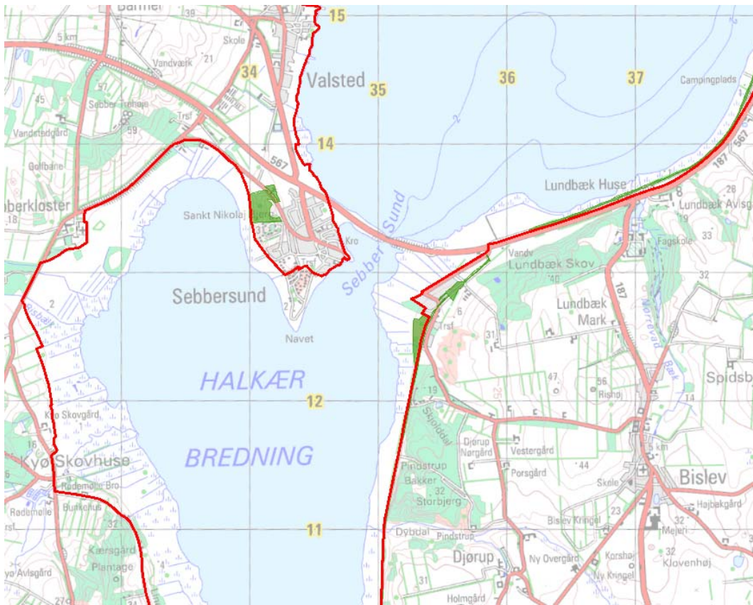
Billede 2 Oversigt over del af Natura 2000-områdets afgrænsning (rød streg) og styrelsens arealer (stærk grøn farve) ved Sebbersund.