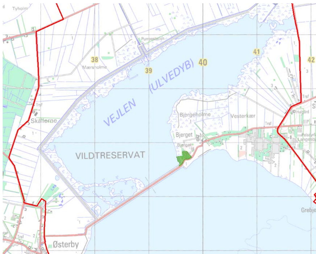
Billede 1 Oversigt over del af Natura 2000-områdets afgrænsning (rød streg) og styrelsens arealer (stærk grøn farve) ved Ulvedyb.

Denne plejeplan følger op på Natura 2000-planen for område N15 Nibe Bredning, Halkær Ådal og Sønderup Ådal , og vedrører Naturstyrelsens arealer på ca. 41 ha.