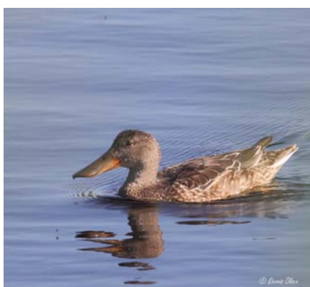
Billede 2 Skeand, hun.

Tabel A viser de arter fra udpegningsgrundlaget, der forekommer i Naturstyrelsens del af området.