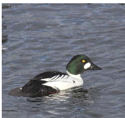
Billede 3 Hvinand, han.