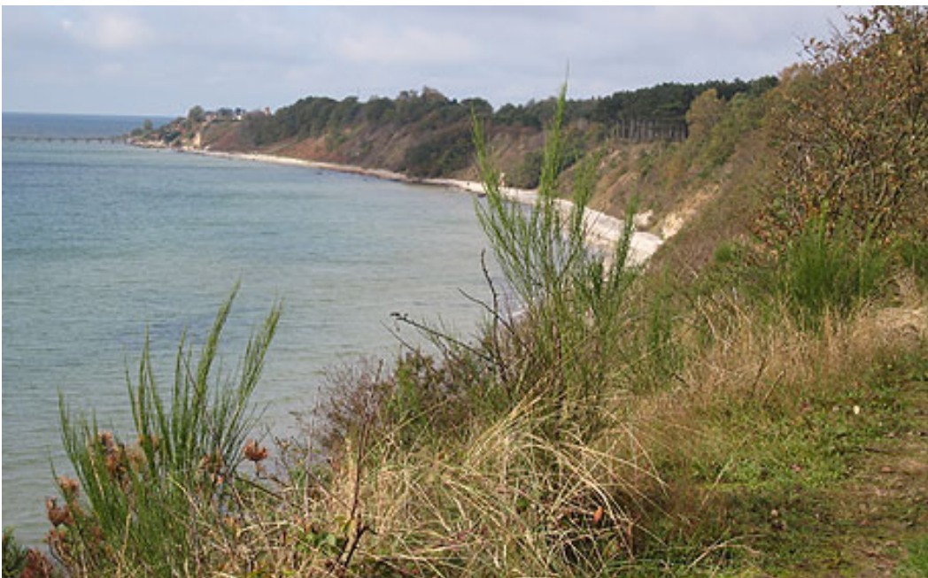
Billede 2 Oversigt over Natura 2000-området. De stejle kystskrænter huser kalkelskende overdrevsvegetation. Gyvel er en problemart som skal bekæmpes.

Plejen af naturtyperne vil bestå i bekæmpelse af problemarten gyvel på 10 % af arealet (se billede 2 og 3).