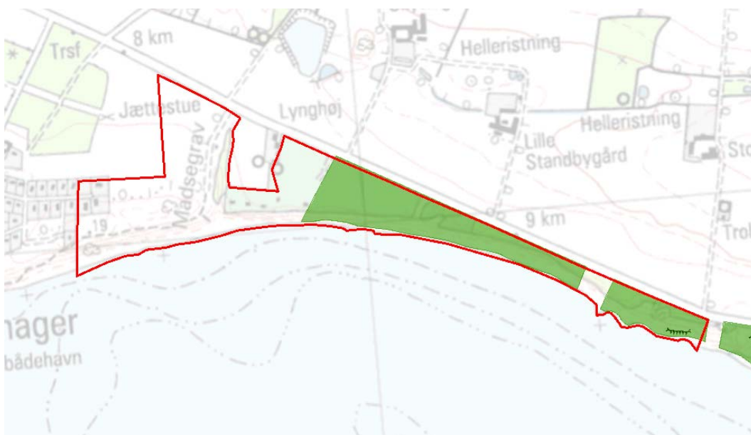
Billede 1 Oversigt over Natura 2000-områdets afgrænsning (rød streg) og styrelsens arealer (stærk grøn farve) i området.

Denne plejeplan følger op på Natura 2000-planen for område N 187 Kystskrænter ved Arnager Bugt og vedrører Naturstyrelsens arealer på ca. 7 ha.