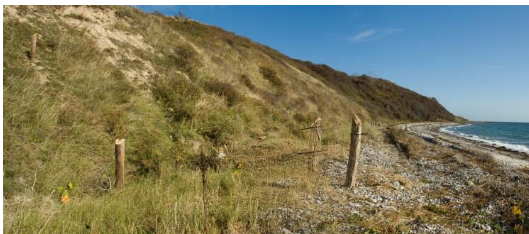
Billede 2 Afgræsset kystskrænt ved Sletterhage, Helgenæs

Tabel A viser Naturstyrelsens arealer med naturtyper i området. Desuden vises de arter fra udpegningsgrundlaget, der forekommer (eller som potentielt vil kunne indfinde sig med den rette forvaltning) i Naturstyrelsens del af området. "Ikke vurderet" vidner om, at der ikke findes nogen arealregistrering for arter.