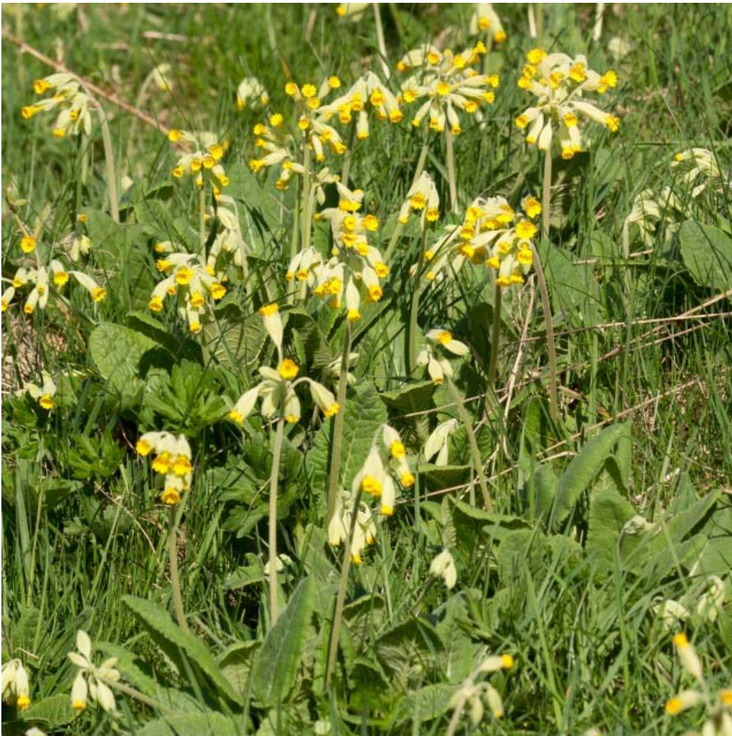
Billede 4 Hulkravet kodriver blomstre i tusindtal, Sletterhage, Helgenæs

Plejen af områdets naturtyper vil samtidig tilgodese en række arter på udpegningsgrundlaget. Der iværksættes ingen specifikke aktiviteter alene af hensyn til arter på udpegningsgrundlaget.