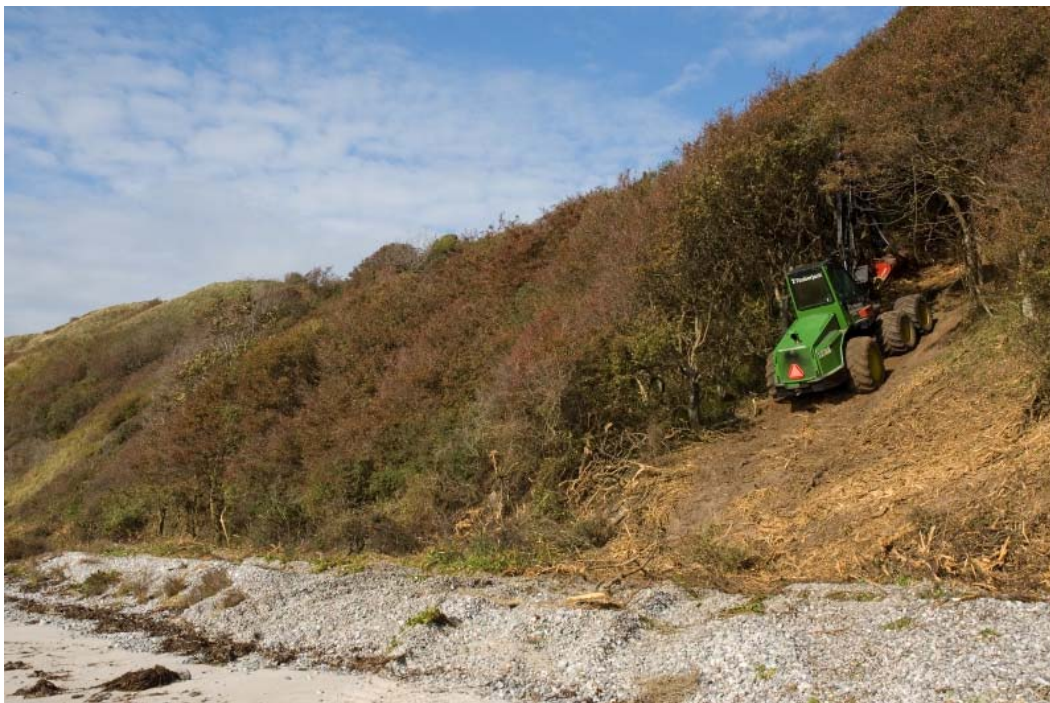
Billede 3 Rydning af opvækst på kystskrænten ved Lushage, Helgenæs. Der etableres en korridor i krattet, således at de græssende dyr kan færdes på skrænten.

Som det ses, er al plejen allerede foreskrevet/igangsat tidligere.