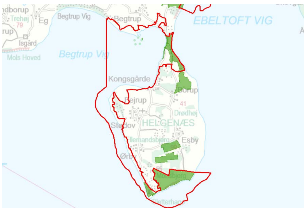
Billede 1 Oversigt over Natura 2000-områdets afgrænsning (rød streg) og styrelsens arealer (stærk grøn farve) i området.

Denne plejeplan følger op på Natura 2000-planen for område N51 Begtrup Vig og kystområder ved Helgenæs og vedrører Naturstyrelsens arealer på 191,27 ha