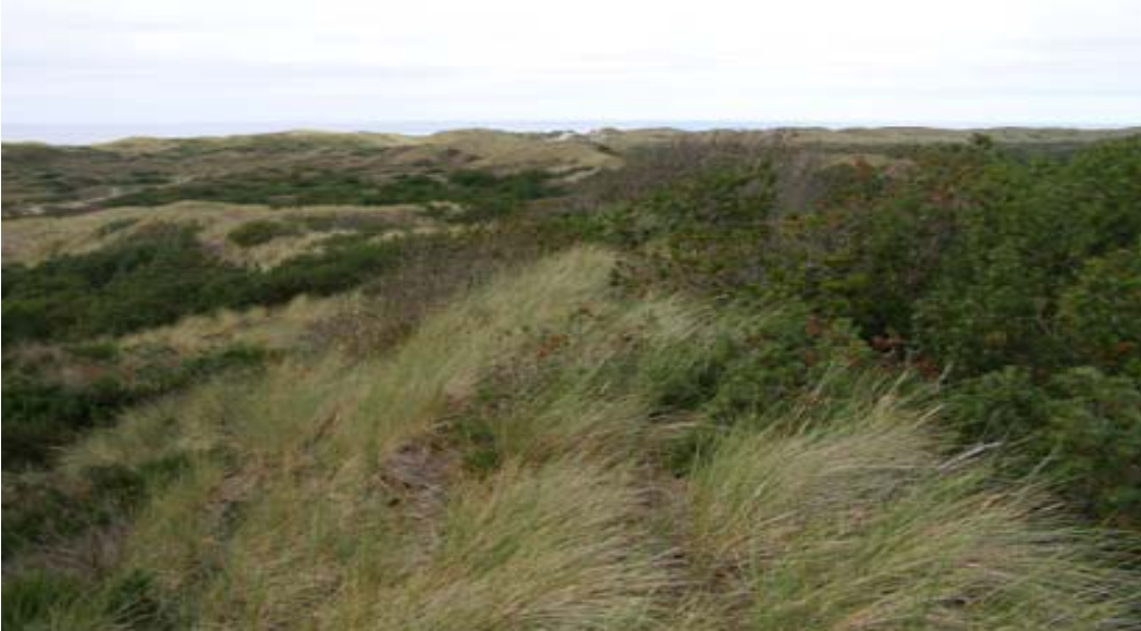
Billede 3 Klitlandskab under tilgroning med bjergfyr.