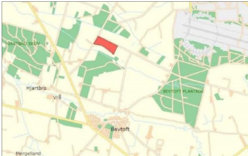
Figur a. Placering af biogasanlægget v. Hjartrbro

Projektet består samlet set af bygning af et biogasanlæg ved Hjartrbro, anlæg af en forbindelsesledning til biogas fra Hjartrbro til tilslutningen til naturgasnettet ca. 1.500 m øst for biogasanlægget.