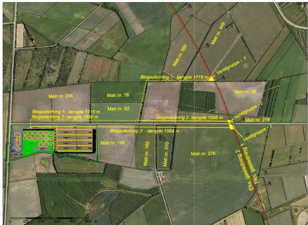
Figur b. Oversigt over det samlede projekt

Projektet består samlet set af bygning af et biogasanlæg ved Hjartrbro, anlæg af en forbindelsesledning til biogas fra Hjartrbro til tilslutningen til naturgasnettet ca. 1.500 m øst for biogasanlægget.