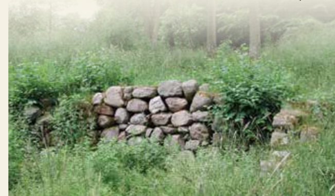
Resterne af Stampemøllen

Området der er skraveret på kortet er udpeget til forstyrrelsesfrit område, især for hjortevildtet. Der er opsat to platforme ved P-pladsen ved Gillelejevej. Herfra kan man betragte de dyr, der trækker ud af skoven for at græsse på de åbne arealer.