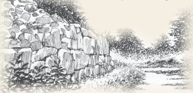
Vestporten til Gamleborg - Se tur 1.

I dag er der kun spredte rester af Højlyngen tilbage. Lyngens frø kan dog overleve længe i jorden, og der kommer ofte lyng igen, når man fælder den gamle skov.