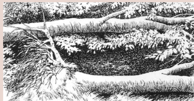
Bøgetræer som væltede i stormen i 1967 - Se tur III.

Staten ejer 2.412 ha eller godt 24 km 2 af Almindingen.