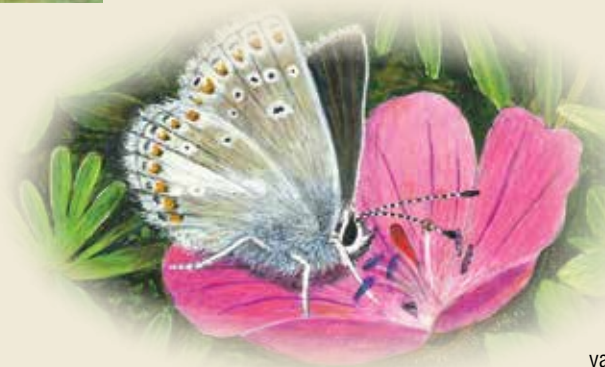
Sortbrun blåfugl på blodrød storkenæb