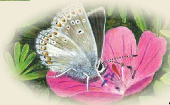
Sortbrun blåfugl på blodrød storkenæb