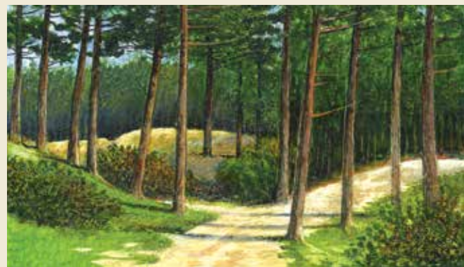
Fyrretræer i Tversted Klitplantage

Den korte rute, Ravklitruuten, går både til Tversted Søerne (2) og Ravklit (3). Turen til og fra Ravklit går malerisk gennem to alléer, enten på kanten af den tidligere vandrekliit, med østrigsk fyr som espalier, eller gennem en allé af ædelgran og sitkagran. Bemærk skovbundens farvemosaik med skiftende grønne farver fra den lysegrønne rensdyrlav til den mørkegrønne revling. Den lilla lyng, der blomstrer fra juli til september, blander sig smukt i dette farvespil.