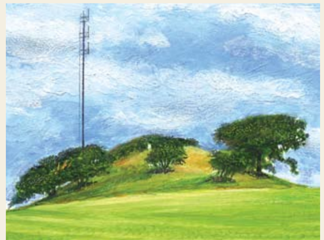
"Vejrhøj" med den høje stålmaster

3. Serpentesporet - et lokalt bjergspor. Stien siksakker sig opad på de mest stejle strækninger. Stien er anlagt således for at udjævne stigningen og give sikkert fodfæste - akkurat som man anlægger veje og spor i bjergrige områder. På de tørre bakker lever mange firben, sommerfugle og insekter, der giver føde til rødrygget tornskade, der sammen med tårnfalken er en typisk fugl på et overdrev (se folderens forside).