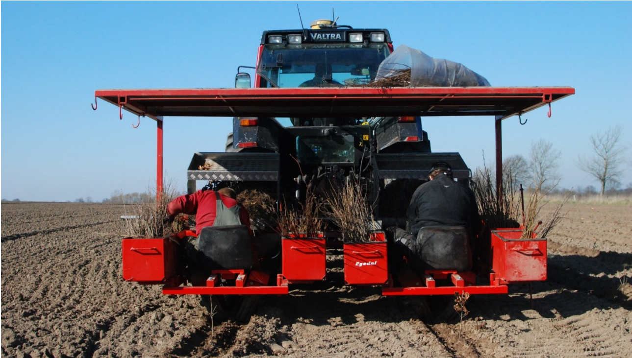
Foto: Plantemaskine i gang med at plante Elmelund Skov