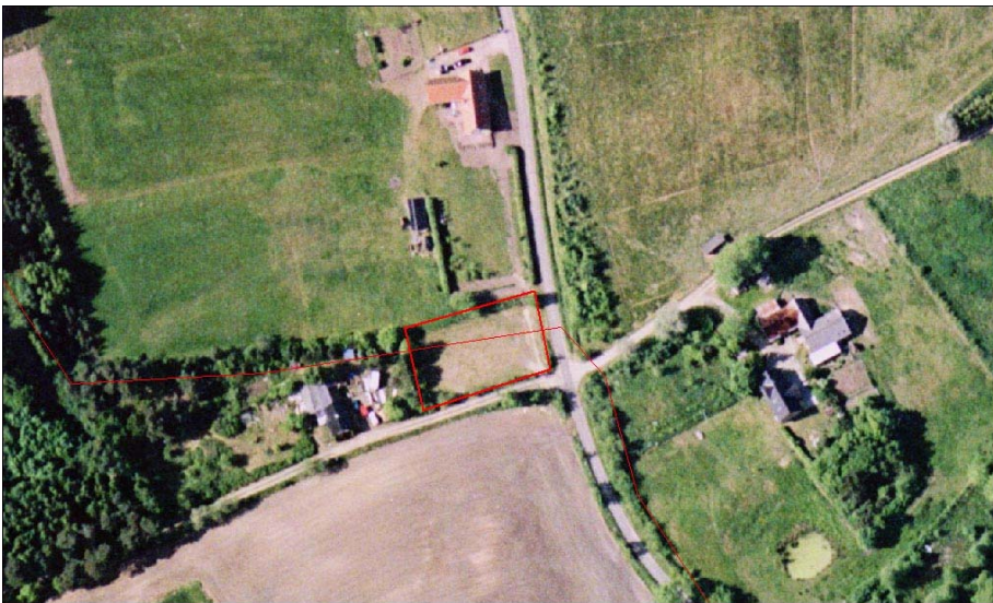
Kort 1, flyfoto af arealet

Kort 1 viser et flyfoto af arealet – bemærk den tynde røde linie der går gennem arealet, det er afgrænsningen af Hærup Sø fredningen.