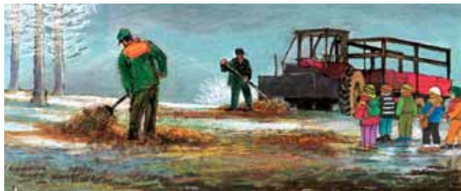
Vinterfodring – Dyrehaven

Om sommeren er der ca. 250 dådyr og 20 krondyr i Dyrehaven. Dådyr færdes oftest i flokke (rudler) og gerne på de åbne sletter. Fra november til april fodres dyrene hver dag. Medbring aldrig løse hunde, der kan skræmme dyrene. Rør ikke nyfødte kalve, og undgå i det hele taget at forstyrre dyrene. Benyt altid Dyrehavens låger og luk dem efter dig. Du finder lågerne ved at følge de afmærkede stier.