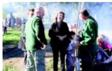
Miljøminister Connie Hedegaard ved indvielsen af Herstedhøje Naturcenter

Gennemførelse af projekter kan strække sig over flere år, bl.a. fordi der skal indhentes tilladelser fra forskellige myndigheder, arbejdsopgaver skal detailplanlægges, der skal ske offentlige høringer, etableres brugergrupper mv. Anlægsarbejder, naturplejeindsats mv. kan også strække sig over flere år. Det betyder, at en række udgifter til de 95 bevilligede projekter først vil afholdes i 2006 og fremefter.