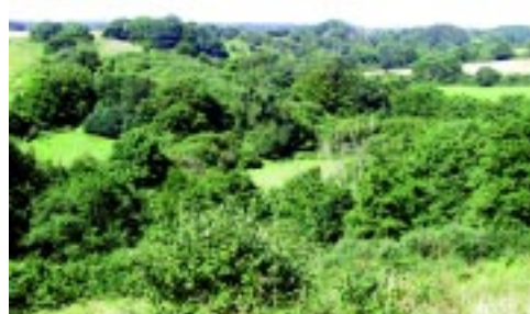
Udsigt over Tapsøre Statskov