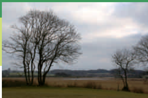
Alssund Golfbane med Mjang Dam i baggrunden