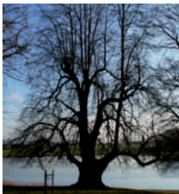
H. C. Andersens Lind

På skråningen syd for slottet vokser et prægtigt Mammuttræ, der kan blive op til 3000 år gammel og kan udvikle sig til et af verdens største træer.