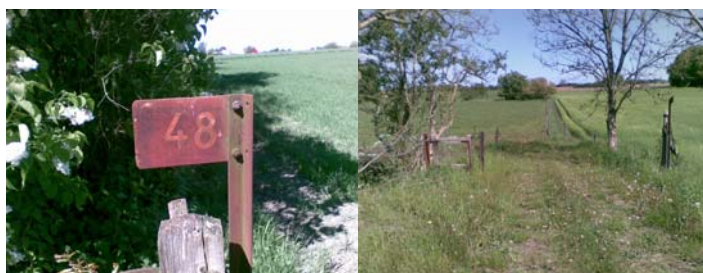
Fig. 7: Overkørselsnummer og oprindeligt led og låge v. overkørsel

Det andet tema kan kaldes den levende planteavlshistorie. Danmarks første planteavlshistorie er Tystofte ved Skælskør, og den nyeste er Flakkebjerg syd for Slagelse. Flere steder skal der plantes langs stien og omkring faciliteterne, og det foreslås, at der bruges robuste historiske sorter af frugttræer og -buske, gerne med en tilknytning til disse to steder.