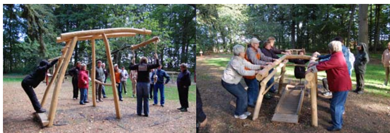
Fig. 1: Redskaber på sundhedspladsen v. Virkethus, Falster

Der er udpeget 6 steder langs banen, hvor der anlægges sundhedsfaciliteter/motionsbaner (bilag 1). Placeringerne 1, 14, 21, 25 og 35 er foreslået af stirådene. Sundhedspladsen på Skælskørs-trækningen flyttes tættere på Skælskør by, da det vurderes, at den foreslåede placering ikke er tilstrækkelig bynær til at give nok brugere. Slagelse kommune vil finde et egnet kommunalt ejet areal tæt på stien. Indretningen af pladsen tilpasses de potentielle målgrupper samt om pladsen er placeret i by eller i det åbne land.