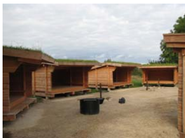
Fig. 4 Shelterplads, Nyord

Der er udpeget 6 steder langs banen, hvor der kan placeres shelterpladser (bilag 4). Shelterpladserne vil typisk bestå af 2-4 sheltere, bålsted(er) m. grill, bænke eller triller omkring bålstedet, bord/bænk-sæt, multitoilet og hane med drikkevand. Placeringerne er foreslået af stirådene. Nr. 19 flyttes evt. til nr. 18, da dette areal er større og bredere, hvilket vil give bedre plads omkring shelterne. Shelterpladsen i Hyllinge by er placeret bynært, og det vil derfor kræve et vist tilsyn fra de lokale beboere. Det vurderes, at det vil være muligt at indlægge vand på alle shelterpladser, bortset fra evt. nr. 37.