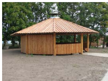
Fig. 5 Bålhytte, Nyord