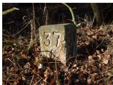
Fig. 6: Original km-sten

Det ene tema – jernbanehistorien – består i at bevare træk fra jernbanen, som kan integreres i den nye sti. De fleste spor er fjernet, men på hovedstrækningen findes de fleste km-sten endnu. Det foreslås, at disse bevares. Enkelte steder findes også rester af de oprindelige led og låger ved overkørslerne, navnlig ved overkørsler, der ikke længere er i brug. Det foreslås, at en eller flere af disse bevares / sættes i stand i samarbejde med museet.