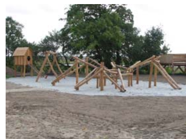
Fig. 2: Legeplads, Nyord