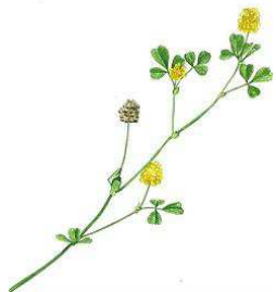
Gul Kløver 5-25 cm. Juni - sep.