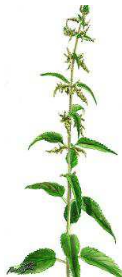
Stor Nælde ( Brændenælde ) 30-130 cm. Maj- aug.