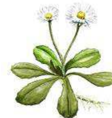
Bellis ( tusindfryd ) 5-15 cm. Marts- nov.