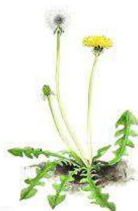
Mælkebøtte 10-50 cm. Maj- aug.