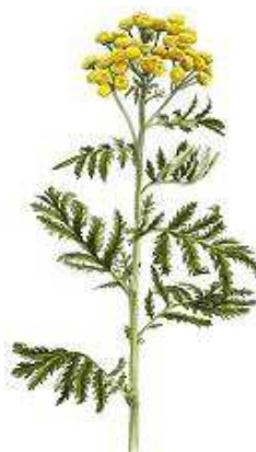
Rejnfan 40-100 cm. Juli- sep.