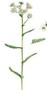
Alm. Røllike 15- 60 cm. Juni- okt.