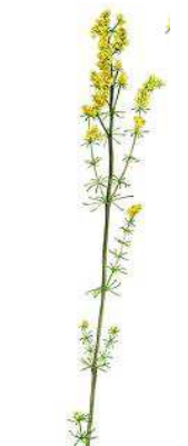
Gul Snerre 10- 40 cm. Juli- aug.