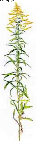
Kanadisk Gyldenris 30-150 cm. Juli- okt.