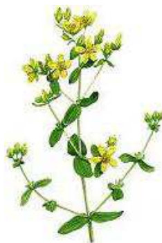
Prikbladet Perikon 30-70 cm. Juli- sep.