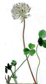
Hvidkløver 10- 30 cm. Juni- sep.