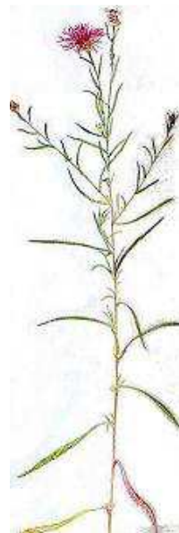
Alm. Knopurt 30-80 cm. Juli.- sep.