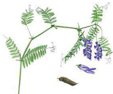
Muse Vikke, 30-100 cm, jun.- aug.