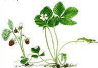
Skovjordbær, 5-20 cm. Maj- juli