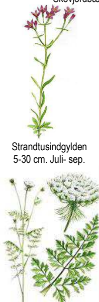
Vild Gulerod 30- 80 cm. Juli- aug.