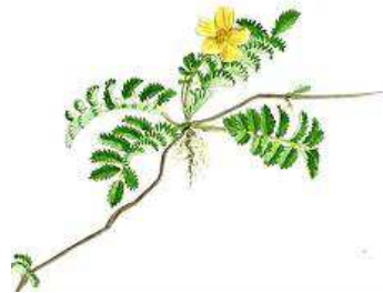
Gåse- Potentil, 30-80 cm, Juni- aug.