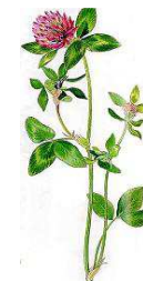
Rødkløver 15-50 cm. Maj -sept.