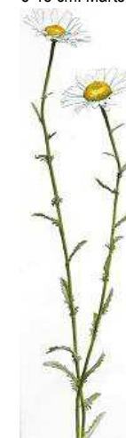
Hvid Okseøje ( Margerit ) 20-70 cm. Juni- aug.