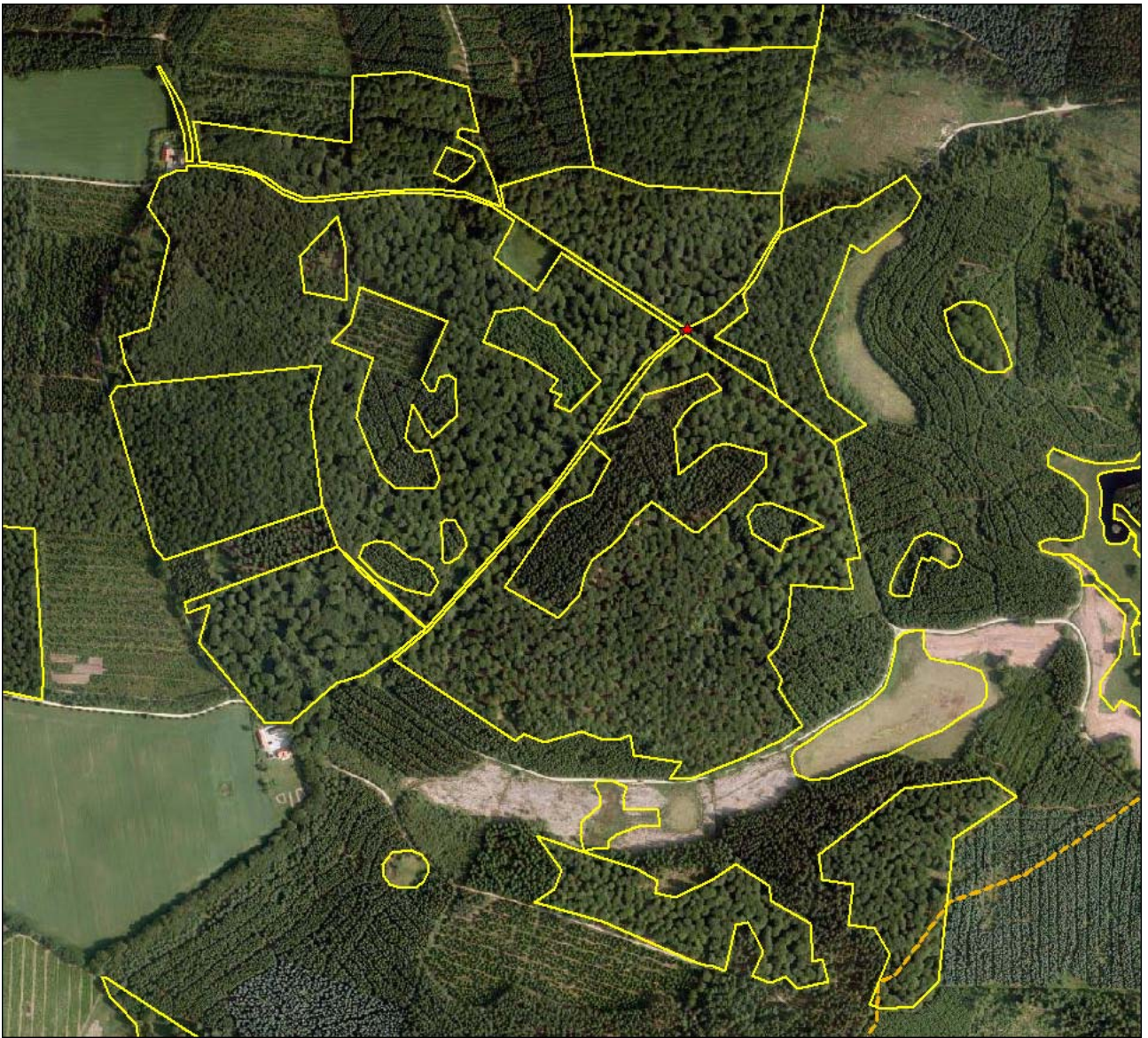
Figur 2 Ekskursionspunkt 2