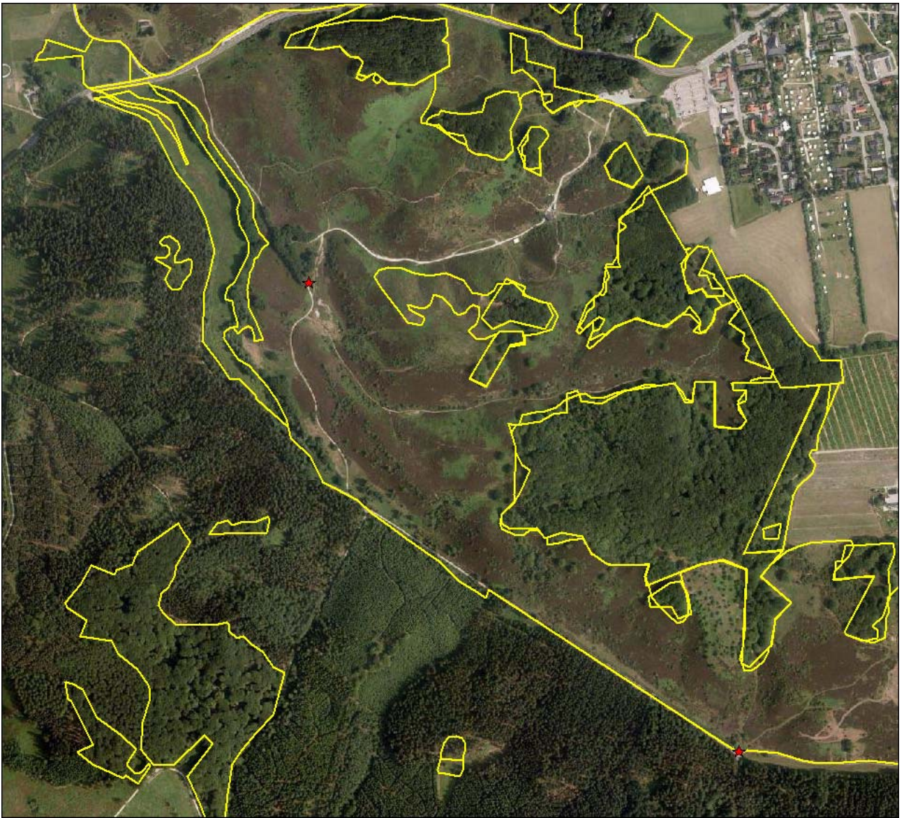
Figur 3 Ekskursionspunkt 4 og 5