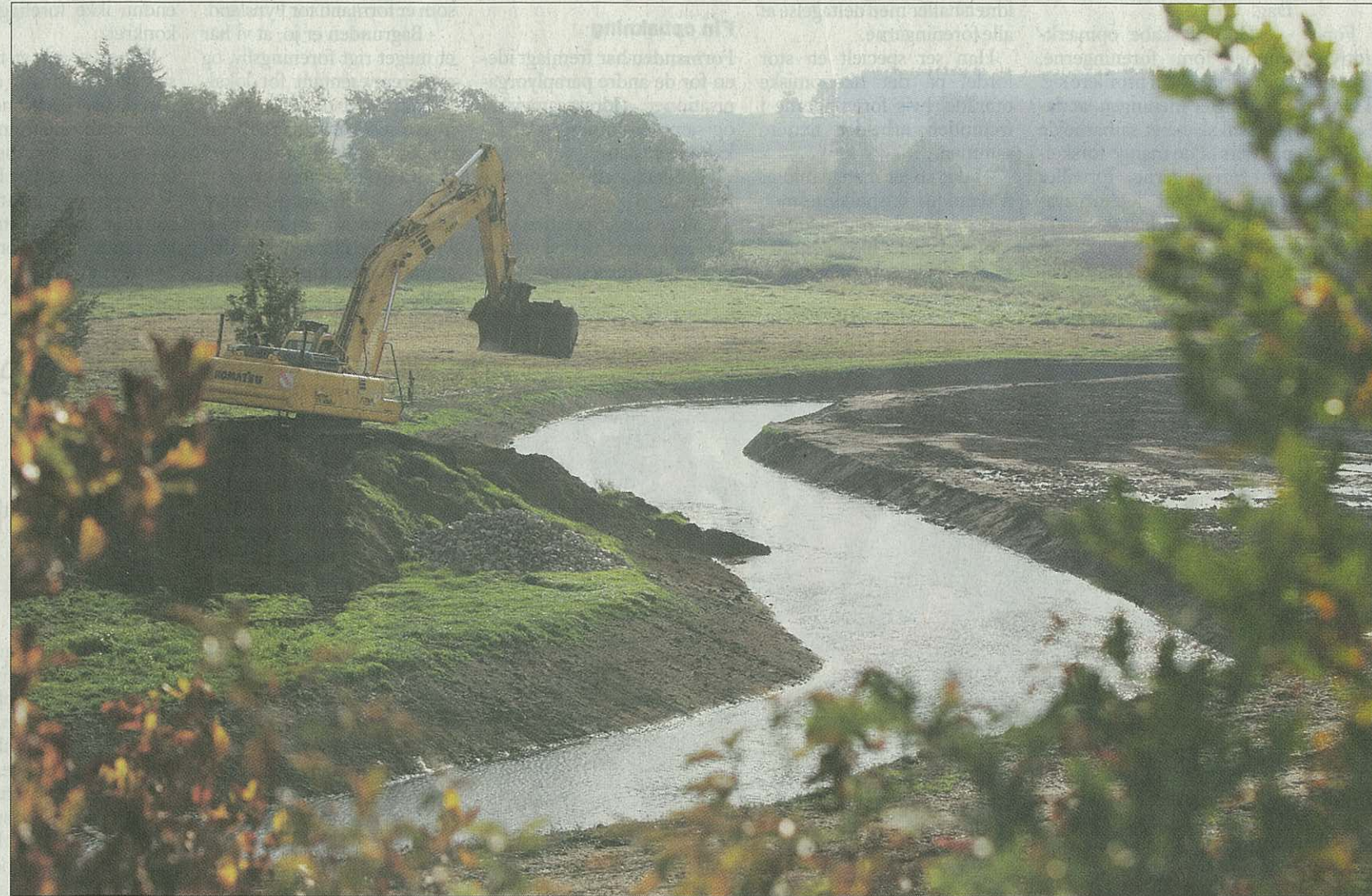
Genopretningsprojektet, hvor Odense Å føres tilbage til et mere naturligt forløb, er blandt de største af sin slags i Danmark. Det færdige projekt løber op i 50 millioner kroner, og i går blev de første ti genslyngninger indviet i Nr. Broby.

Genopretningsprojektet er et af de største af sin slags i Danmark. Formålet er at føre åen tilbage til et mere naturligt forløb. Samtidig bliver der lukket for markdræn, så der blandt andet opstår sumpe