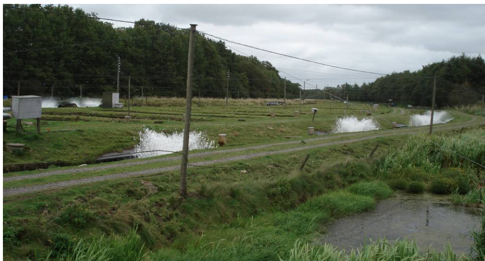
Figur. 2.1. Ådalen ved Gørding Mølle Dambrug.

Langs dalens sydlige side er der en plantet skovet 10 m bredt læhegn med nåle- og løvtræer, som påtænkes fældet i forbindelse med projektet.