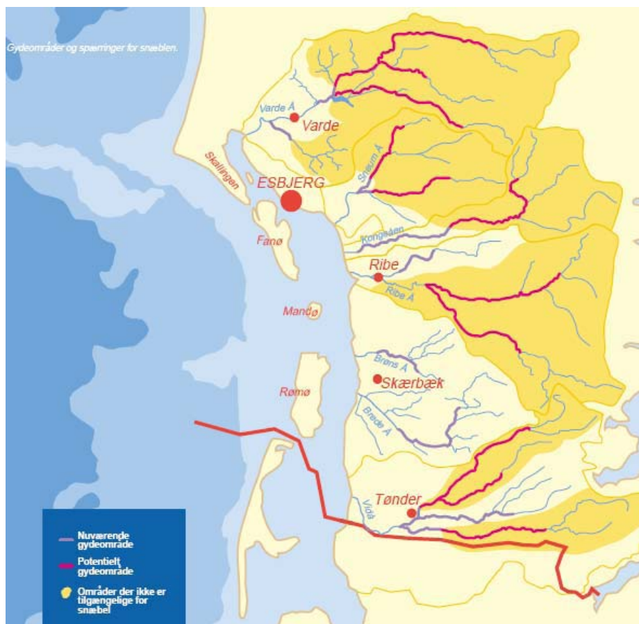
Figur 1.1 Nuværende og potentielle gydeområder for snæbel (hvh. tyk lilla streg og tyk rød streg), samt områder der ikke er tilgængelige for snæbel, vist med mørkegul /1/.

Danmark har opnået støtte fra EUs LIFE-fond til et naturgenopretningsprojekt til ca. 100 mio. kroner, som skal redde snæbelen. Naturprojektet, også kaldet Snæbelprojektet, omfatter en lang række delprojekter i de fire sydvestjyske vandløb: Varde Å, Sneum Å, Ribe Å og Vidå (Figur 1.1).