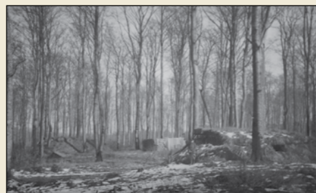
Bunkers i skoven