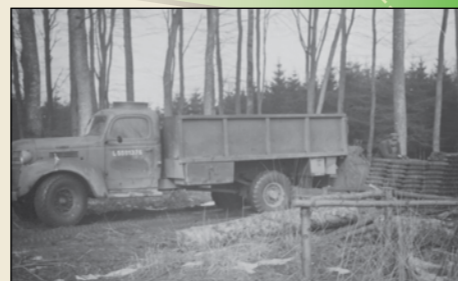
Borttransport af granater