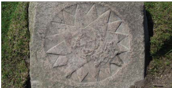
Midt i parforcestjernen i Store Dyrehave ligger denne sten.

Herefter ventede kongen ved en af vejstjernerne på, at parforcejagthornet skulle kalde ham til. Han brugte et kort sværd - en hirschfænger - til at give dyret nådesstødet. Denne form for jagt kræver et stort areal i et relativt åbent landskab, hvor flokke af heste og hunde kunne jage byttet af sted over stok og sten, for en stor kronhjort kan løbe fra hundene i omkring et par timer.