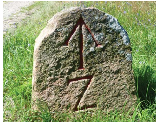
Vejsten fra 2-vej ved Stjernen i St. Dyrehave.

På ovenstående kort fra slutningen af 1600-tallet kan man se det fuldt udbyggede parforcevejssystem i Store Dyrehave, sydøst for Hillerød.