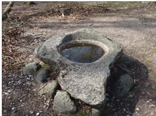
På Fantasiens Ø i Præstevang ligger "Døbefonten" - en stor granitsten med en tilvirket fordybning. Et mere prosaisk navn ville nok være "Fuglebadet".

Sporene efter disse indhegnede plantager og enkelte af disse træer kan stadig ses.