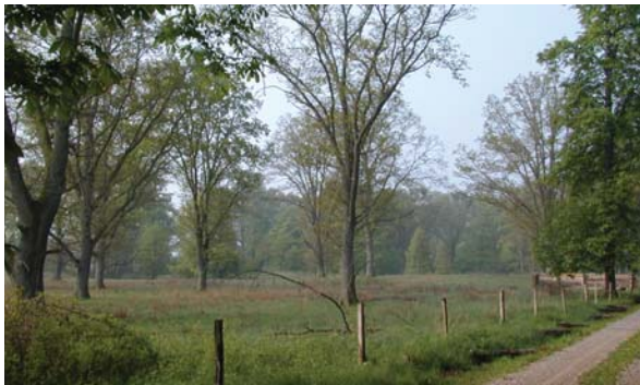
Pibervang i Gribskov, hvor heste fra Frederiksborgs stutteri engang gik og græssede.