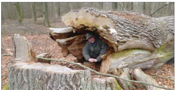
Træet til herover har engang stået på markerne ved den nu forsvundne landsby Ostrup.