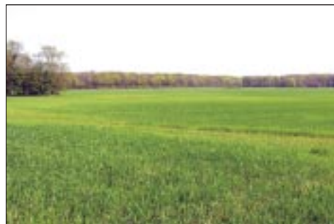
På denne intensivt drevne mark vil naturskoven i Draved Skov i baggrunden fremover brede sig

I 2006 blev det muligt at erhverve et meget centralt beliggende areal på 26 hektar omgivet af Draved Skov, som er en unik naturskov i dansk sammenhæng. Ejendommen har hidtil været drevet som konventionelt landbrug, men vil med ministeriets erhvervelse blive omlagt til naturlig succession. Det vil give en enestående mulighed for at udvide en af landets eneste urskovslignende arealer, så det samlede areal med urørt statslig natur komme over 550 ha.. Samtidig vil det betyde, at udledning af næringsstoffer fra det tidligere landbrugsareal ophører. Det vil blandt andet gavne den nærliggende Kongens Mose, som er beskyttet af EU som habitat-område, ligesom det bliver muligt at lukke afvandringsgrøfterne fra arealet, der i dag udtørre de omliggende højmoser.