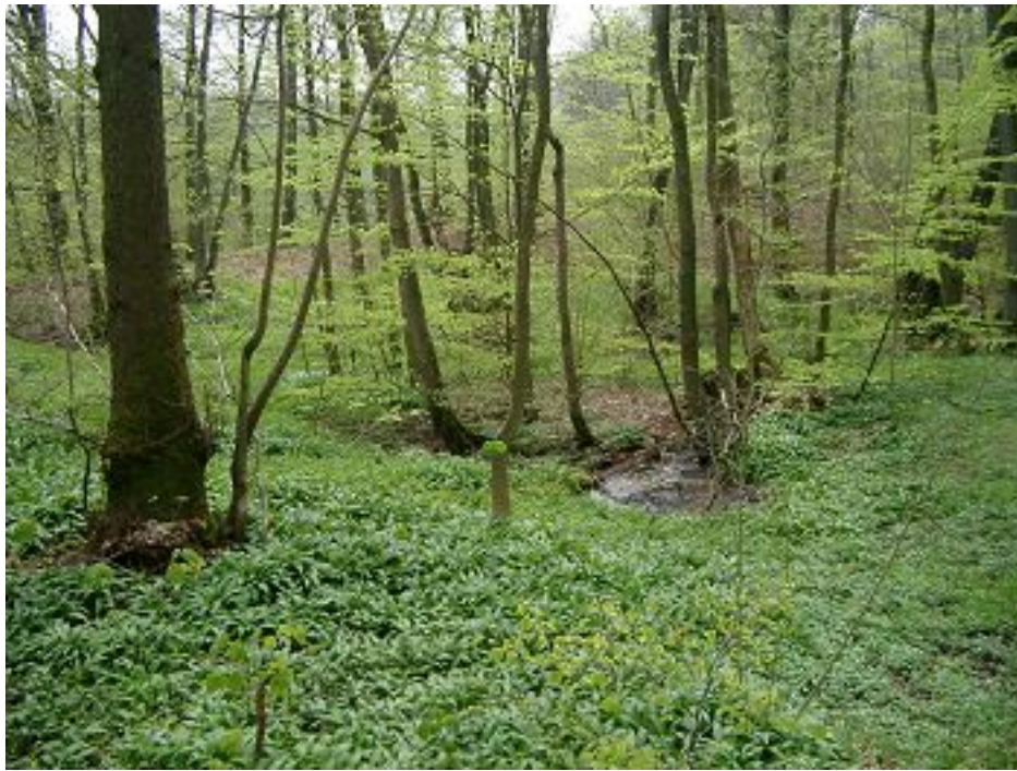
Pøsekilden maj 2005

Området umiddelbart omkring Vestersøen er en undersøgelse værd. Flere steder springer der friske kildevæld op af jorden. Bl.a. Pøsekilden, Ulvekilden og Vestersø Kilde. Sidstnævnte leverer vand til Vestersøen, som blev kunstigt anlagt i 1975 ved opstemning. Husk gummistøvler hvis i ønsker at komme tæt på kilderne. Områderne omkring er sumpede og våde, men det er alligevel forsøget værd at bevæge sig derud, idet man belønnes af det interessant syn af frisk klart kildevand der vælter op af jorden. Vandet er jernholdigt hvorfor jorden omkring udspringet mange steder er gul-orange. Tæt ved søen kan man opleve slotsmølleåen, der smukt slynger sig gennem Rise enge. Åen modtager bl.a. vand fra Vestersøen og Pøsekilden. Åen er blevet naturgenoprettet, dvs genslynget, i 1997, og det har bl.a. betydet at der igen er kommet mange ørreder i åen. Så er der de mange enge. Frodige, grønne, græsfulde pletter midt i skoven. Disse lysåbne pletter medvirker til at give området sin specielle karakter. Engene afgræsses af køer og førhen var de bl.a. kendt som et yndet fourageringsområde for storke. Tæt ved Vestersøen finder man Ulvekule. Navnet Ulvekule antyder at der har været drevet jagt på ulve i området førhen. Det skete bl.a. ved at fange dem i dybe faldgrave og det er utvivlsomt en sådan, der har givet stedet sit navn.