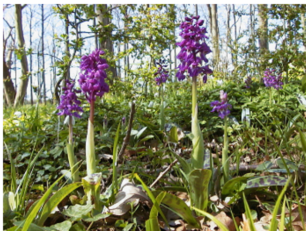
Tyndakset gøgeurt i fuld flor

I området omkring Vestersøen kan man finde orkideen Tyndakset Gøgeurt. Den er sjælden i Nord- og Vestjylland og findes kun hist og her i resten af landet. Det er en meget smuk orkidé, med purpurrøde blomster på et langt slankt blomsteraks. Bladene er mørkegrønne på oversiden, ofte med mørke pletter og minder en del om de blade vores stueorkideer har. Den bliver mellem 15-40 cm høj og blomstrer lige nu og frem til juni. Orkideerne stiller ofte store krav til deres miljø, hvorfor forandringer i miljøet kan få dem til at forsvinde. De har et livsnødvendigt samliv og afhængighedsforhold til en speciel svamp, der forsyner orkideens frø med næring, som kan få frøet til at spire og vokse. Denne proces er yderst langsommelig fordi det kan tage flere år før frøet har samlet næring nok til at danne rødder og sætte blomsterbærende skud over jorden. Tyndakset gøgeurt er fredet, hvilket betyder at man ikke må plukke den, grave den op eller beskadige den.