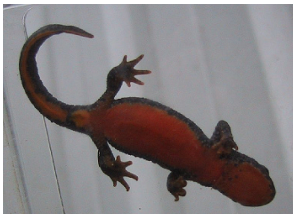
Den ensfarvede bug på en bjergsalamander