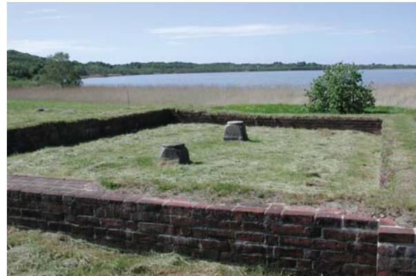
Dronningholm ligger med udsigt over Arresø.