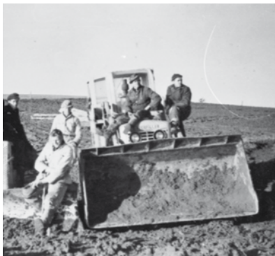
Gravning af kanaler i Slivsø 1957/58

I tiden omkring anden verdenskrig opstod tanken om at dræne søen og omskabe søbunden til frugtbar agerjord. Afvandingsprojektet tog form gennem 1950'erne.