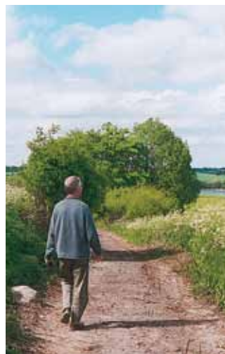
Udsigt fra den gamle Kirkesti fra Diernæs