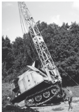
.....det var ikke så let