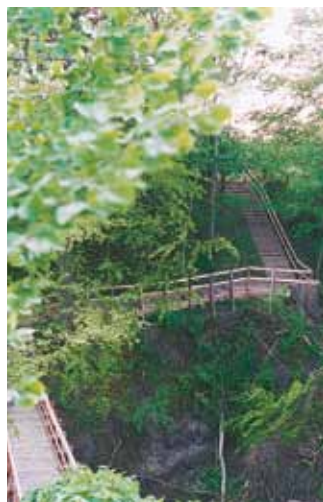
Trappen over Skærbækslugten