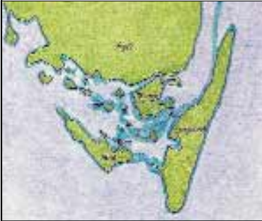
Øhavet for 6.000 år siden

I stenalderen for 12.000 - 9.000 år siden, lå havet lavere end i dag og Øhavet var tørt land. For 6.000 år siden trængte havet ind over land, så kysten lå en kilometer vest for Vejlen. 1000 år senere trængte vandet ind i Vejlen. Stenalderbopladser og træstubbe på havbunden vidner om livet inden den voldsomme synfloed skabte havet på frier .