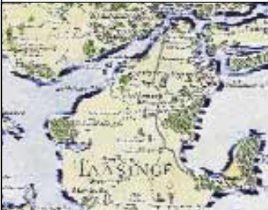
Kort fra 1700-tallet. Vejlen er en havarm.