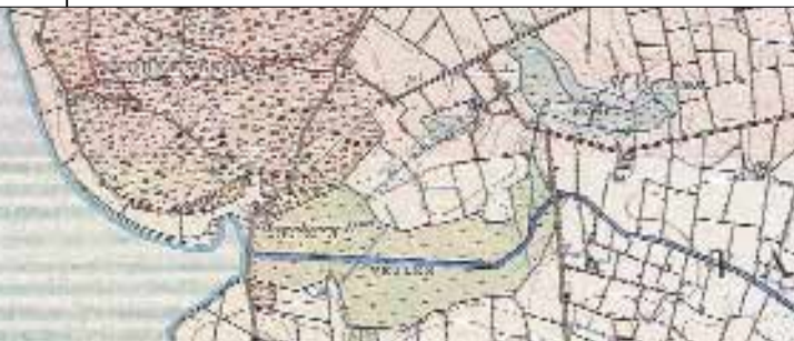
Kort fra 1890. Vejlen er én stor eng.