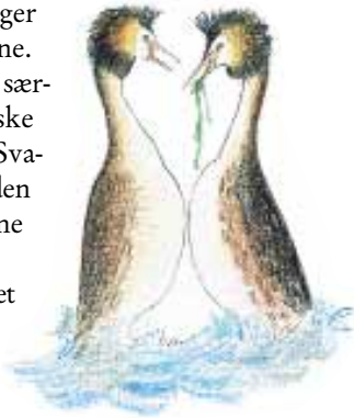
Toppet Lappedykker i parringsleg

Vadefugle er tilpasset livet på de våde enge. Fuglene trives bedst, når vandstanden er høj og engen græsses af kreaturer. Ved denne drift rummer området mange smådyr, som vadefuglene lever af. Fra april yngler i området Viber, Rødben og Bekkasiner. Med deres karakteristiske flugt og sang giver de engens særlige lyd billede, som vi kender og holder af.