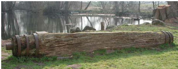
Den gamle mølleksel fra Stenholt Mølle ligger nu til beskuelse ved mølledammen i Esrum.