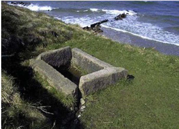
Herover ses det ene af de to stenkar ved den berømte Helene Kilde, der udspringer umiddelbart øst for Tisvildeleje.