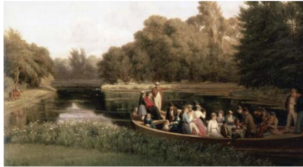
På Jørgen Sonnes maleri fra 1865 bliver fint klædte gæster fra København roet op ad Esrum Kanal gennem Snevret Skov. Billedet hænger på Frederiksborgmuseet.