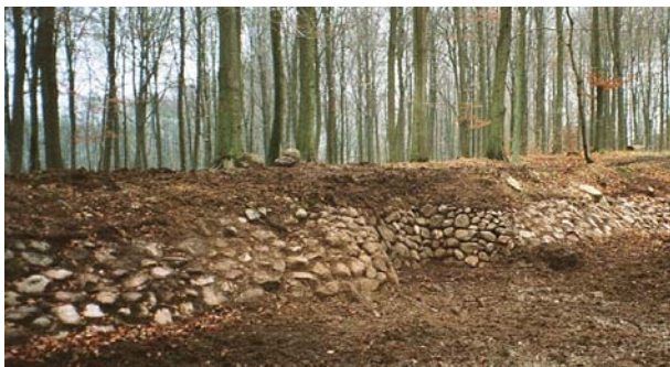
I den sydlige del af Gribskov kan man tydeligt se resterne af